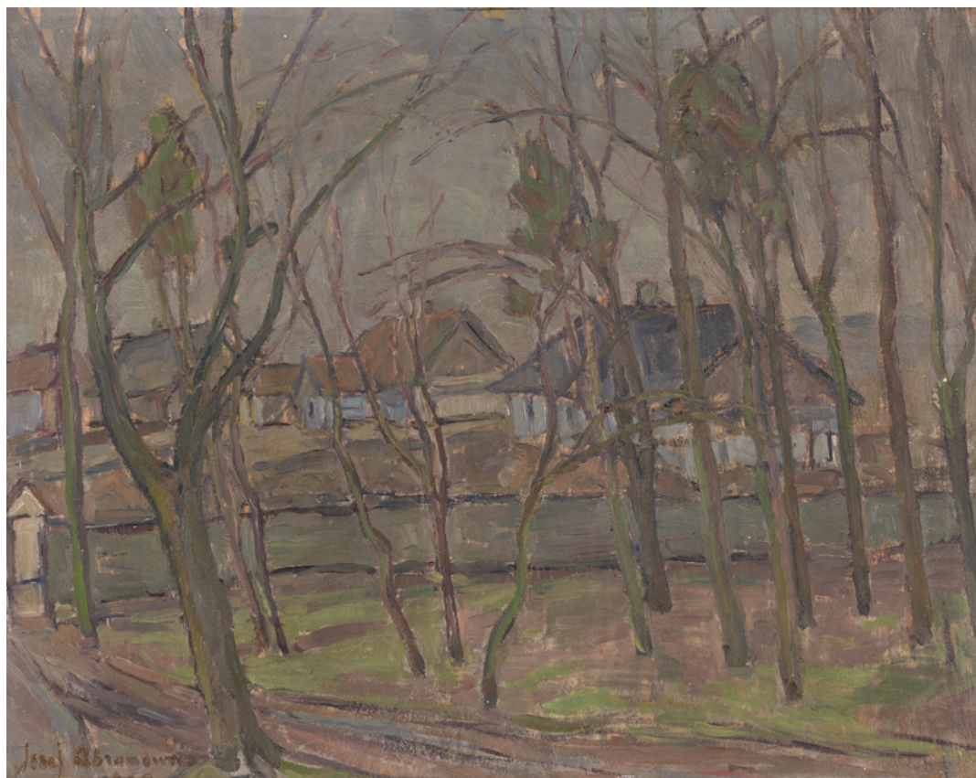
Il. 1. Józef Abramowicz, Pejzaż przedwiosenny , 1960, sklejką, technika olejna, 45 × 50 cm, nr inw. S/Mal/527/ML, fot. Muzeum Narodowe w Lublinie