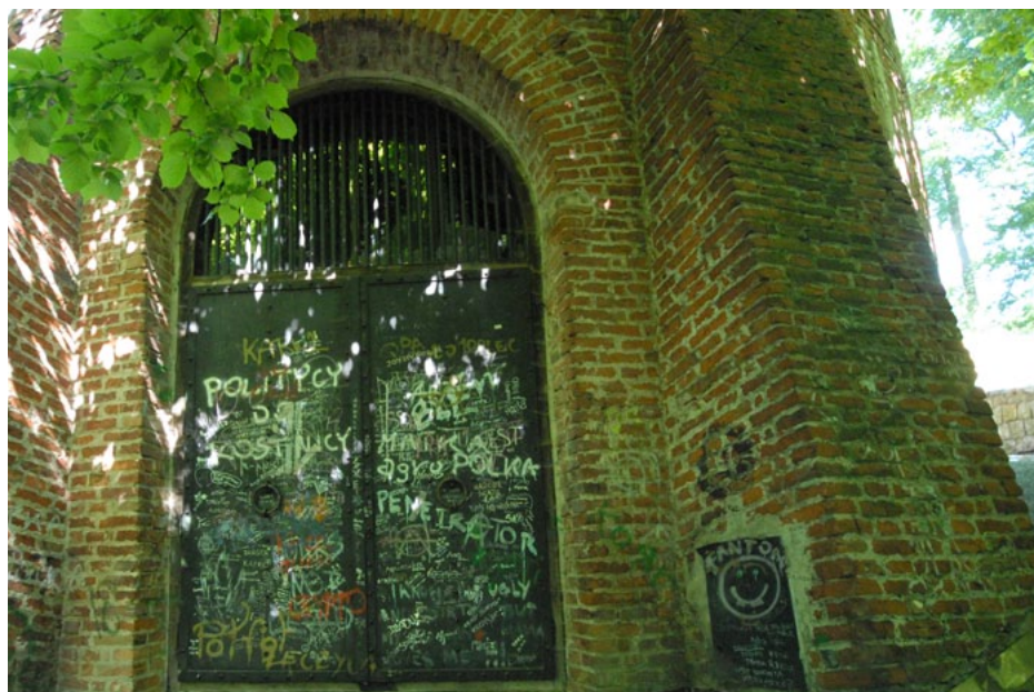
Il. 1. Świątynia Sybilli w Parku Czartoryskich w Putawach, stan z 2011 roku