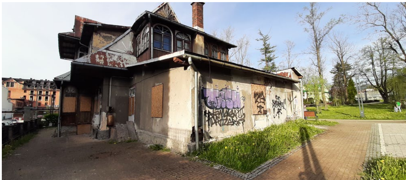
Il. 2. Dawna Szkoła Muzyczna w Zakopanem, stan z 2023 roku

Przy analizie tego rodzaju spraw warto pamiętać, że „argumenty natury ekonomicznej [...] nie mogą być przesłanką do rezygnacji z działań dążących do zachowania substancji i wartości zabytkowej [...] budynku w momencie ich realnego zagrożenia postępującą degradacją” 32 . Nie wystarczy oparcie się na przedłożonej przez właściciela budynku opinii