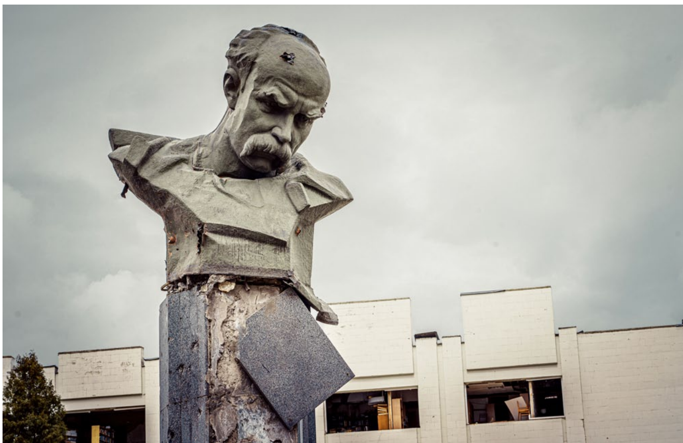
Il. 1. Ostrzelany pomnik Tarasa Szewczenki, kwiecień 2022 roku, fot. Yurii Veres

Międzynarodowa solidarność wobec zniszczeń dóbr kultury w Ukrainie