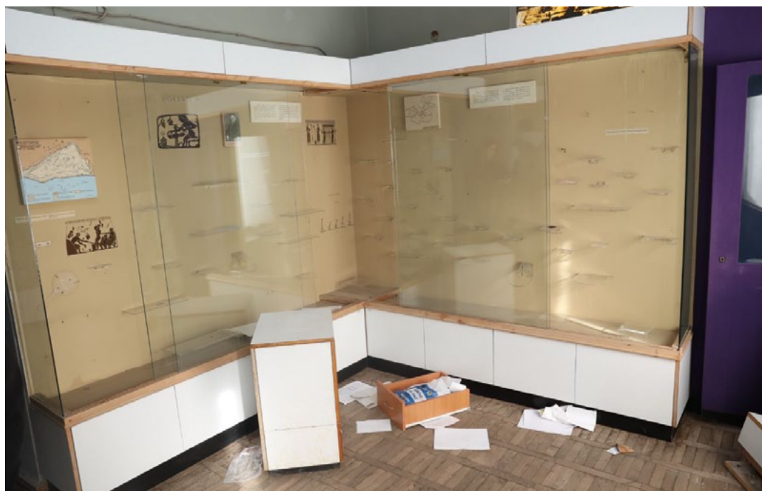
Il. 2. Muzeum w Chersoniu splądrowane przez siły rosyjskie

Także w kwietniu 2022 roku Rada Miasta Mariupola opublikowała informacje o kradzieży ponad 2 tys. obiektów z Muzeum w Mariupolu.