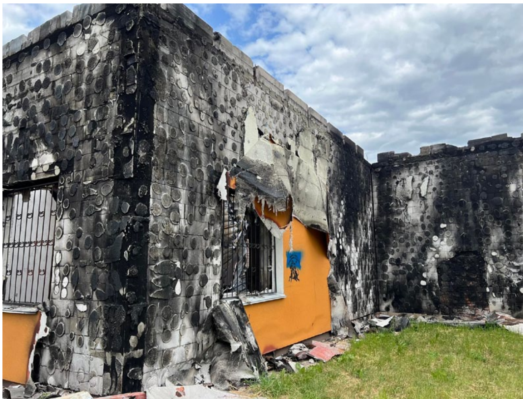
Il. 4. Zniszczony gmach Muzeum w Iwankowie po rosyjskim ostrzale 25 lutego 2022 roku, fot. Ministerstwo Kultury i Polityki Informacyjnej w Ukrainie (CC BY 4.0, za pośrednictwem Wikimedia Commons)