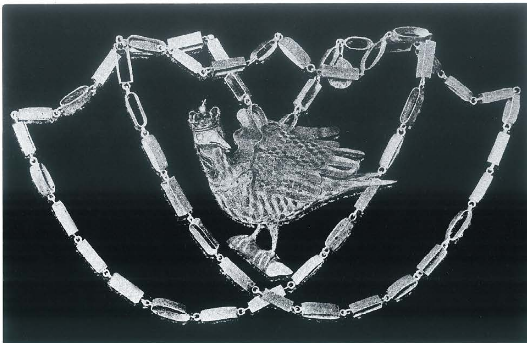
Kur strzelecki, Godło Tarnowskiego Bractwa Kurkowego, wzmiankowany w 1555 r.