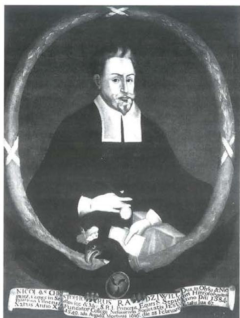
Mikołaj Krzysztof Radziwiłł „Sierotka”, XVII w., Muzeum Narodowe w Warszawie.

Nieśwież – legendarna litewska rezydencja jednego z najpotężniejszych rodów Rzeczypospolitej, przetrwał szczęśliwie w swym materialnym kształcie, pomimo licznych najazdów i grabieży. Zamek tamtejszy wznosił z wielkim rozmachem książę Mikołaj Krzysztof Radziwiłł, zwany „Sierotką” (zm. 1616 r.), wojewoda wileński, wybitny mecenas i koneser sztuki, będący jedną z najciekawszych postaci polsko-litewskiego państwa na przełomie XVI i XVII stulecia. Budowla kilkakrotnie powiększana, w wieku XVIII została przekształcona w okazałą, choć prowincjonalną siedzibę kresowych magnatów. Z dawnej wspaniałości wnętrza i wypełniających je bogatych zbiorów artystycznych nie przetrwało w Nieświeżu nic. Druga wojna światowa i dokonana przez władzę radziec-