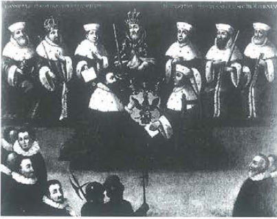
Nadanie tytułu książęcego Mikołajowi Radziwiłłowi „Czarnemu”, 1 poł. XVII w. Zaginiony.

zów historycznych i batalistycznych, ilustrujących dzieje rodu Radziwiłłów i Sobieskich. Wymienione obrazy to prace zarówno prowincjonalnych twórców pozostających na służbie książęcej, jak i malarzy profesjonalistów o ugruntowanej sławie, nie-