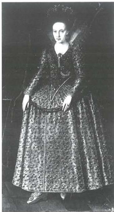
Elżbieta Stuart, mal. Marcus Gheeraerts mł., ok. 1618 r. Państwowe Muzeum Sztuki w Mińsku.

ropolskich zbiorów malarstwa. Ze wstępnej oceny wynika, iż wszystkie przeciwności przetrwało około 10% jej zawartości spisanej w XVIII w. Dzisiaj obrazy są rozdzielone pomiędzy Państwowe Muzeum Sztuki w Mińsku i Muzeum Narodowe w Warszawie. Pojedyncze portrety w różnych okolicznościach zawędrowały również do zbiorów muzealnych w Krakowie, Wilnie i Poznaniu.