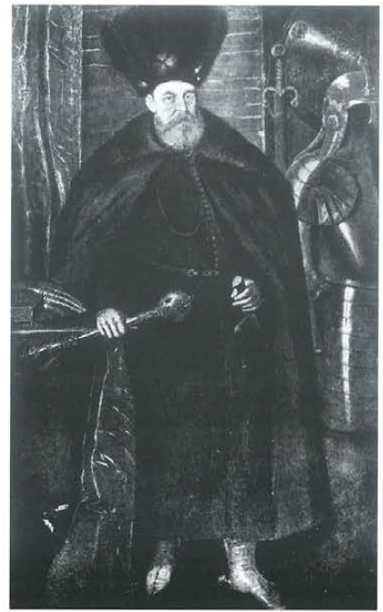
Lew Sapieha, początek XVII w. Zaginiony. Fot. Archiwum Zamku Królewskiego na Wawelu

Radziwiłłowskie zbiory w Nieświeżu przestały istnieć, lecz zarówno z racji swojej pozycji w dziejach polskiego kolekcjonerstwa, jak i ze względu na wartość historyczną i artystyczną, zasługują na ideową rekonstrukcję.