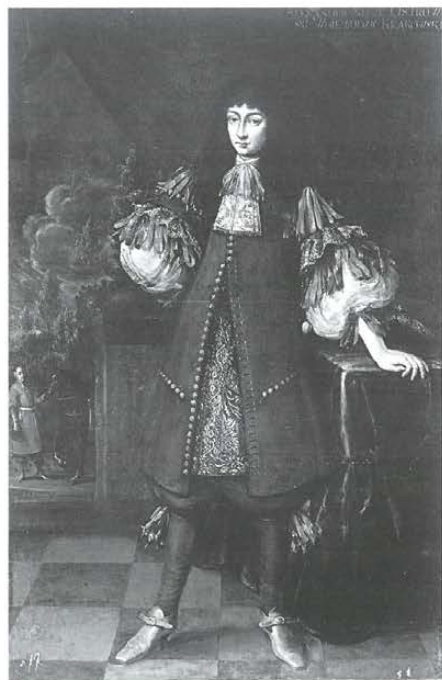
Aleksander Ostrogski, mal. Andrzej Stech (?), ok. 1670 r. Państwowe Muzeum Sztuki w Mińsku.