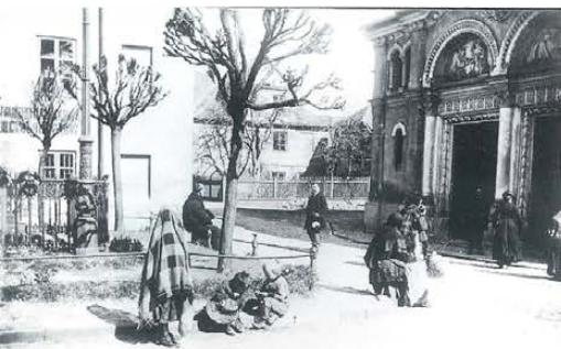
W Wielką Sobotę przed kościołem Panny Marii na Nowym Mieście w Warszawie, lata 90. XX w.