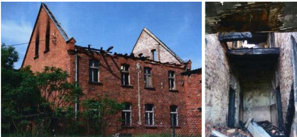
Komora celna w Silnie , straty spowodowane bezpośrednio pożarem w dniu 26 maja 2016