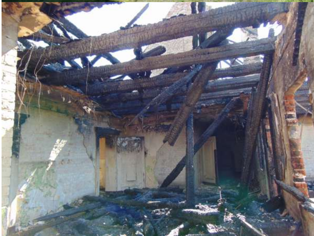
Pałac w Belczu Wielkim, straty spowodowane bezpośrednio pożarem w dniu 15 maja 2016