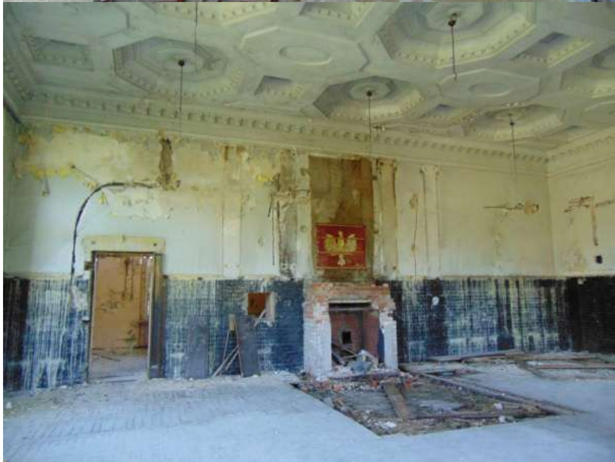
Pałac w Belczu Wielkim, straty spowodowane akcją gaszenia pożaru w dniu 15 maja 2016