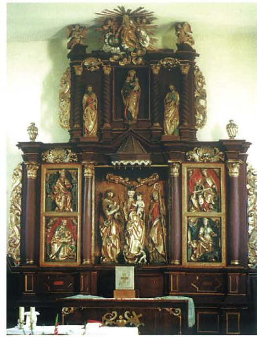
Ołtarz w Cegłowie przed konserwacją