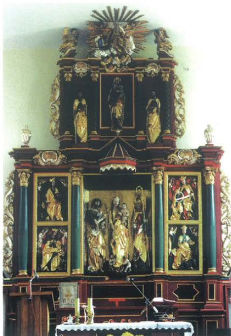
Ołtarz w Ceglówie po konserwacji