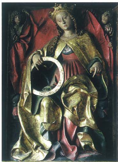
Prawe skrzydło tryptyku kwatery górna, św. Katarzyna przed i po konserwacji