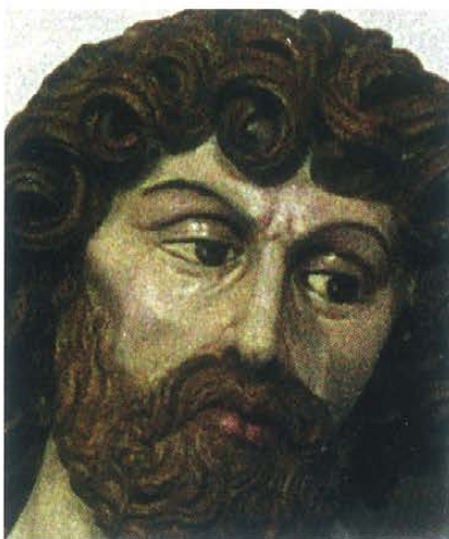
Św. Jan Chrzciciel – stan po konserwacji...