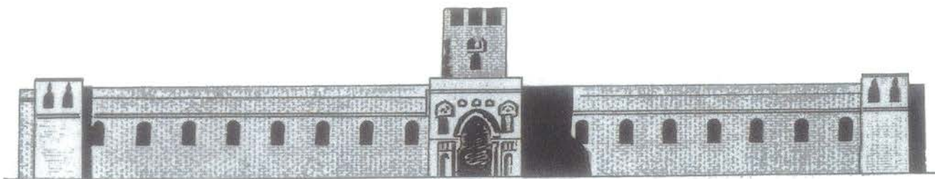
▲ Meczet sultana Bajbarsa – tzw. Fort Sulkowskiego. Fasada pn.-zach. z głównym wejściem i wznoszącym się ponad nim fragmentarycznie zachowanym minaretem (nie zachowanym do dzisiaj). Stan z 1800 r., wg Description de l'Égypte

nej we wrześniu 1260 r., Mamelucy rozgromili wojska mongolskie dowodzone przez Kitbugę, powstrzymując tym samym ekspansję mongolską na tym obszarze i chroniąc Egipt przed groźbą inwazji. Zwycięskiemu sultanowi niedługo dane było cieszyć się owocami zwycięstwa. Kilka tygodni po bitwie, w drodze powrotnej do Egiptu został zamordowany w wyniku spisku uknutego przez oficerów z jego najbliższego otoczenia. W trakcie polowania na pustyni został obezwładniony przez jednego ze spiskowców i zabity ciosem szabli zadany w plecy. Jego zabójca, emir Bajbars, bezzwłocznie udał się do namiotu sultańskiego, gdzie za zgodą najwyższych dowódców zasiadł na tronie sultana. Jego droga do najwyższej władzy wiodła ze stepów Kipczaku, skąd pochodził, przez targ niewolników w syryjskiej Hamie, gdzie zakupiony został do mamelukiej gwardii sultańskiej. Odnajdując się potężną budową i nieomylnym instynktem politycznym, piął się po szczeblach kariery wojskowej, by w końcu