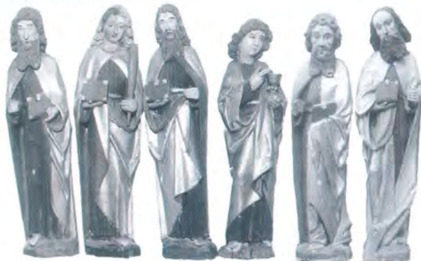
247. AUTOR NIEZNANY Figury 12 apostołów ze skrzydeł gotyckiego tryptyku, XV w. Drewno polichromowane, wys. ok. 55 cm. Kat.PC-1155