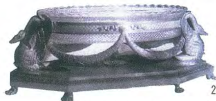
251. VASE , Saxony, 18th cent. Prcelain, height about 70 cm. Cat.RE-376