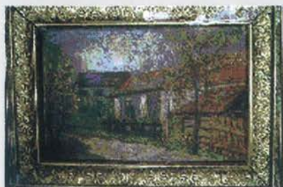
27 ikon XVII–XIX wiek, 4 olejne obrazy, XIX w., Boguszowice, Polska. Zaj. 15.11.2002 r.

1 maja 2002 r. Biuro RILO dla Europy Środkowej, agenda Światowej Organizacji Ceł w tym regionie, zainicjowało projekt specjalny „OBELIKS”. W ramach projektu RILO CE, na podstawie informacji uzyskanych od celników z regionu Europy Środkowej, publikuje raporty z materiałem zdjęciowym i opisowym zajętych dzieł sztuki. Od maja 2002 r. odnotowano około 200 prób przemytu dzieł sztuki w tym regionie. Obok umieszczone są przykłady materiałów przekazywanych przez służby celne regionu Europy Środkowej.