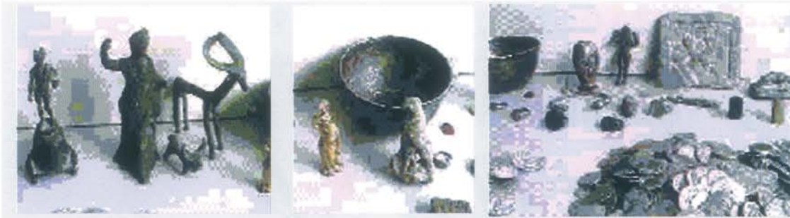
Ok. 1000 szt. monet oraz przedmiotów starożytnych, Kalotina, Bułgaria. 31.03.2003 r.

wprowadziła program pozwalający na pełną współpracę wszystkich międzynarodowych organizacji zajmujących się zwalczaniem nielegalnego obrotu kulturalnej własności.