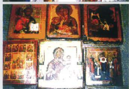
49 obrazów, Budapeszt, Węgry. 09.09.2002 r.