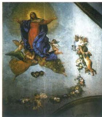
▲ Polichromie w kaplicy pw. Niepokalanego Poczęcia NMP (stan po konserwacji). Fot. J. Miler, 2001 r.

Powróćmy jednak do dziejów katedry łacińskiej. W jej pobliżu znajduje się jeszcze kilka interesujących zabytków, a wśród nich brama wjazdowa prowadząca na plac otaczający katedrę (dawny cmentarz katedralny). Ozdobioną posągami św. Jana Nepomucena bramę