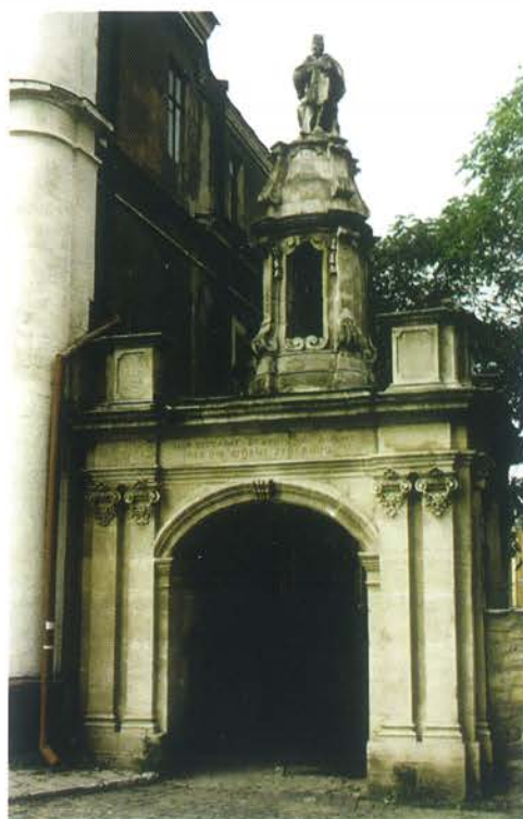
◀ Brama triumfalna dla króla Stanisława Augusta przy katedrze łacińskiej.