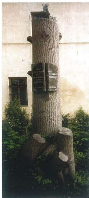
▲ Pomnik Jerzego Michała Wołodzyjowskiego.