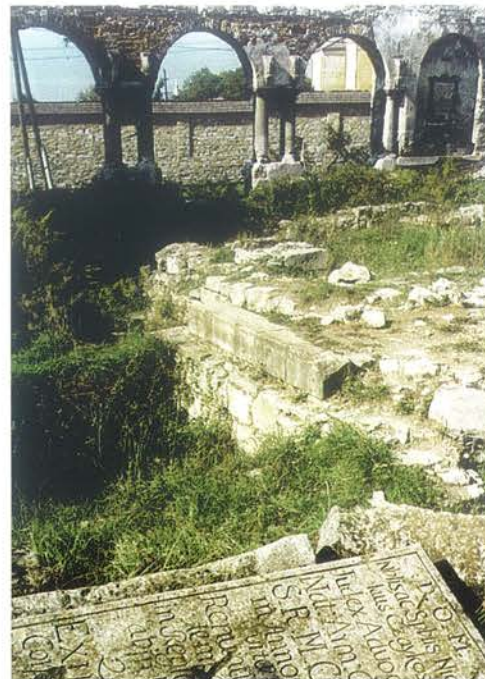
▲ Pozostałości zburzonej katedry ormiańskiej. Fot. J. Krasnodębski, 1995 r.

Mikołaja Kopernika w Toruniu dotowało Biuro Pełnomocnika Rządu do spraw Polskiego Dziedzictwa Kulturowego za Granicą.