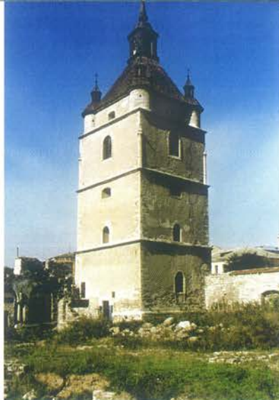
▲ Wieża katedry ormiańskiej.