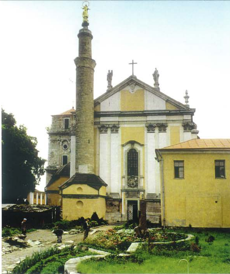
▲ Katedra pw. śś. Piotra i Pawła w Kamieńcu Podolskim. Fot. J. Miler, 1997 r.