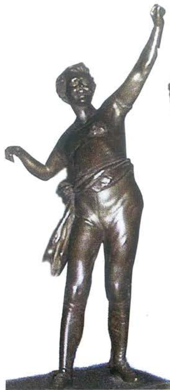
Figure of a Man. Bronze, height 55 cm (with base) CAT. PC-1306