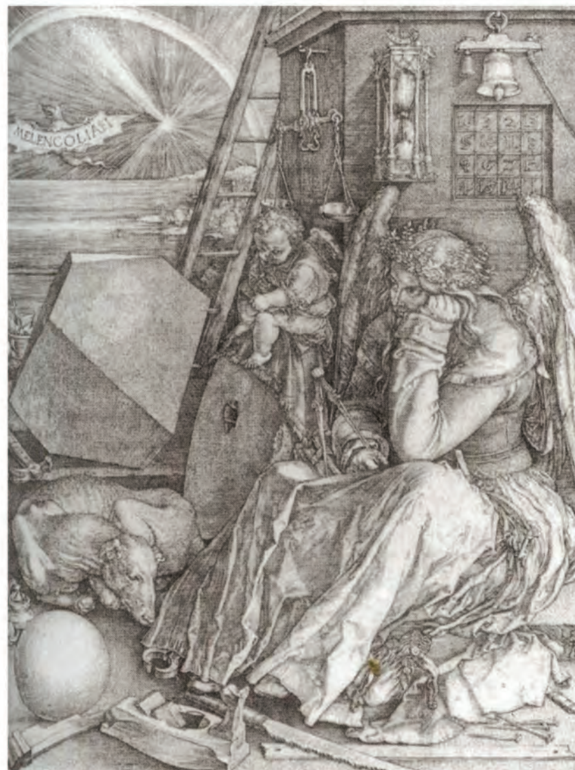
Melancholia , Albrecht Dürer, 1517, miedzioryt, zarejestrowany w bazie strat wojennych pod numerem 54 749.

The electronic database at the Wartime Losses Unit of the Ministry of Culture and National Heritage, Department of Cultural Heritage, is the only national register of cultural property that had been lost as a result of World War Two from the territory of Poland as established after 1945. It was set up in the early 1990s, but has been modernised many times since that time. Now it registers over 63 000 records divided into 23 sections, such as archeology, graphic arts and drawings, painting, sculpture, artifacts made from non-precious metals, wooden artifacts, fabrics, coins, ceramics, instruments and vehicles. Access to