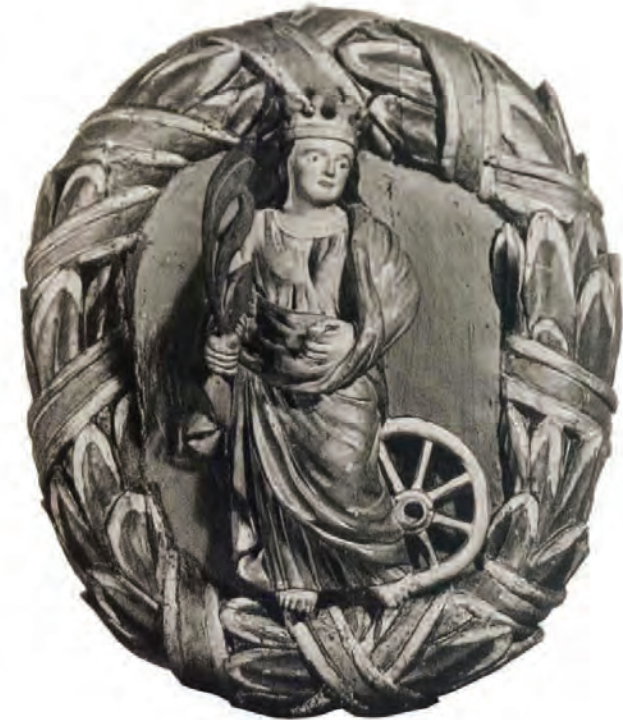
Zwornik z postacią świętej Katarzyny, warsztat gdański, 2. poł. XVII w., znajdował się w południowej nawie Kościoła Św. Katarzyny w Gdańsku; zarejestrowany w bazie strat wojennych pod nr 23 293.

E lektroniczna baza strat wojennych Wydziału ds. Strat Wojennych Departamentu Dziedzictwa Kulturowego w Ministerstwie Kultury i Dziedzictwa Narodowego jest jedynym ogólnopolskim rejestrem dóbr kultury utraconych w wyniku II wojny światowej pochodzących z terytorium Polski w granicach po 1945 r. Jej głównym celem jest archiwizacja zebranych, możliwie jak najpełniejszych, informacji na temat obiektów zagrabionych wskutek działań wojennych. Wszelkie dane zapisane w bazie są podstawą do prowadzenia przez wydział poszukiwań strat wojennych i podejmowania działań restytucyjnych.