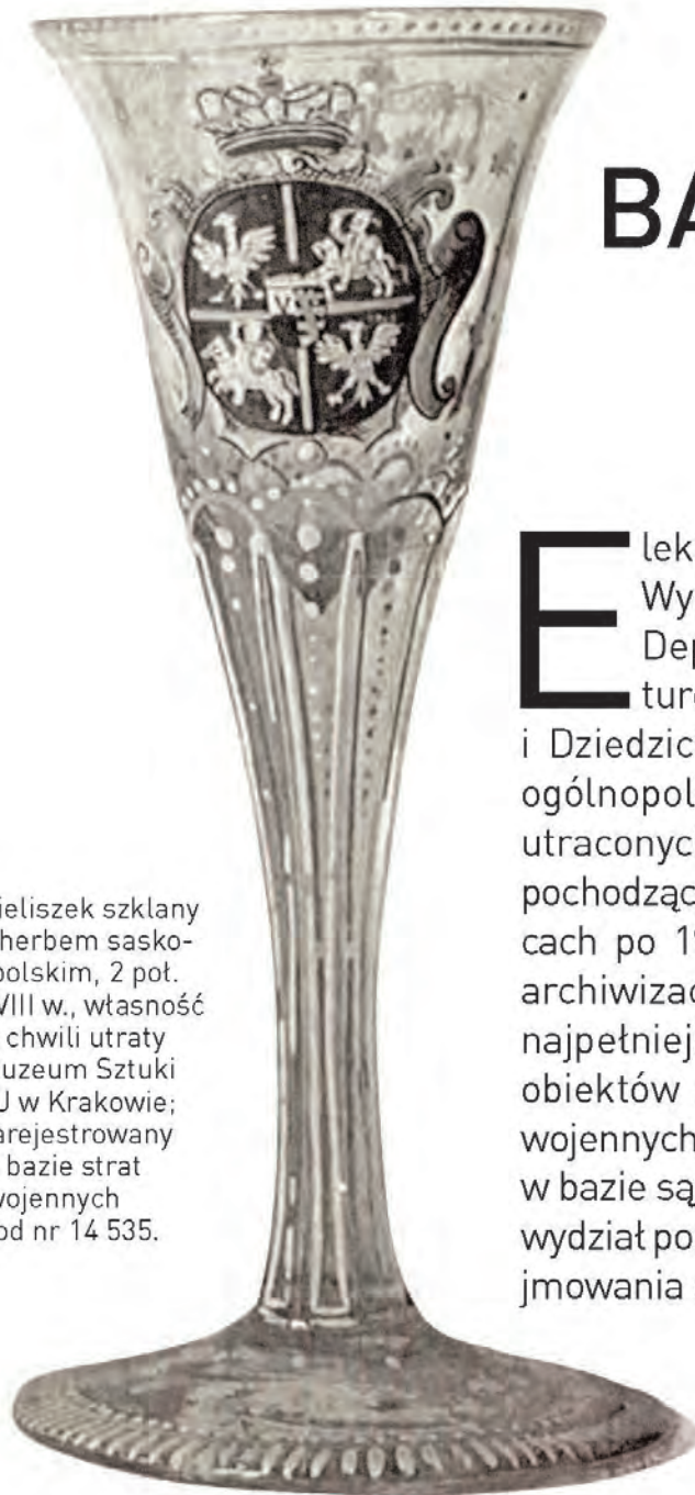
Kieliszek szklany z herbem sasko-polskim, 2 poł. XVIII w., własność w chwili utraty Muzeum Sztuki UJ w Krakowie; zarejestrowany w bazie strat wojennych pod nr 14 535.