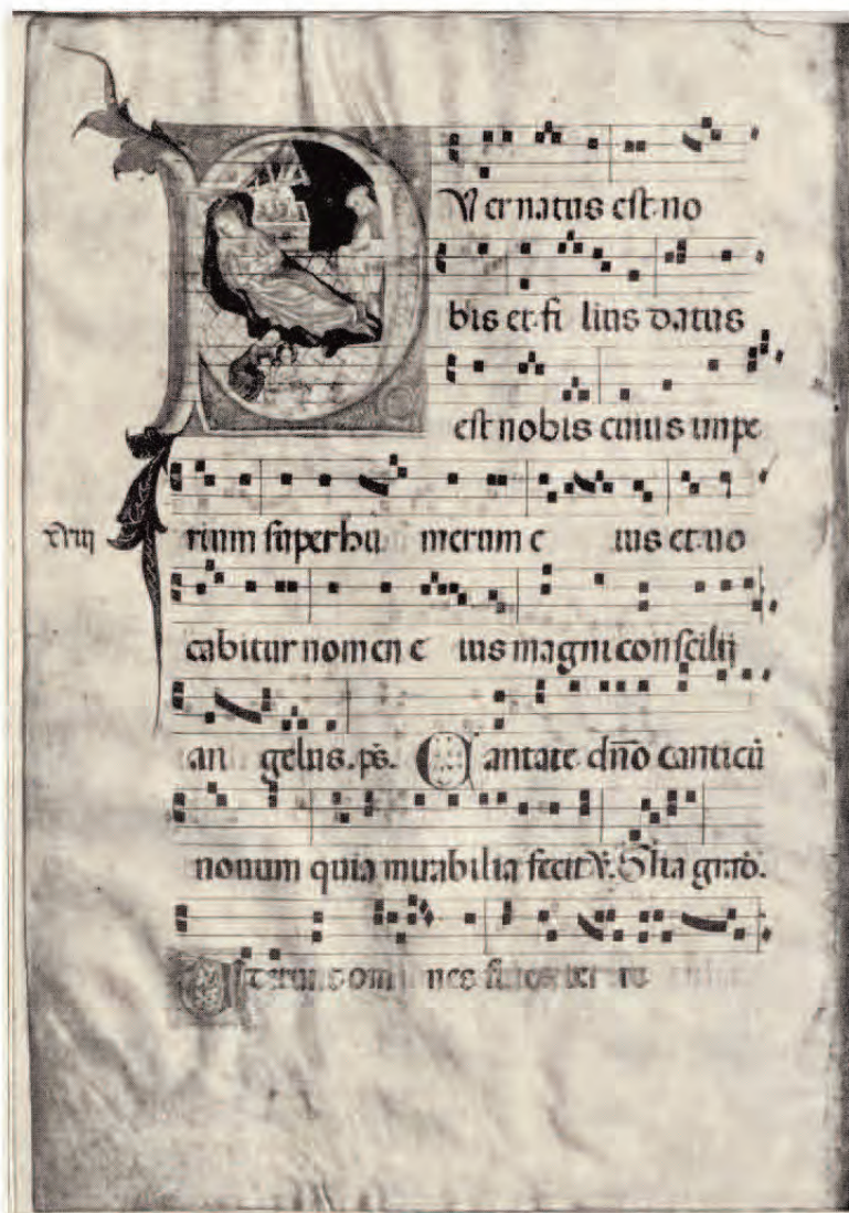
Inicjał P ze Sceną Bożego Narodzenia z kąpielą Dzieciątka w balii, Włochy, pocz. XV w., własność w chwili utraty Muzeum Narodowego w Warszawie; zarejestrowany w bazie strat wojennych pod nr 9085.

Należy zdawać sobie sprawę z niedokładności niektórych wpisów lub braku niektórych danych w kartach obiektów, jednak każda, nawet niepełna informacja o utraconym dziele jest ważna. Czasem wystarczy jedynie numer inwentarza, opis w katalogu bądź fotografia obiektu bez tytułu, by potwierdzić, czy dany zabytek jest polską stratą wojenną. Zarejestrowanie każdego nowego obiektu przybliży do stworzenia możliwie najdokładniejszego rejestru utraconych przez Polskę ruchomych dóbr kultury w wyniku wojny.