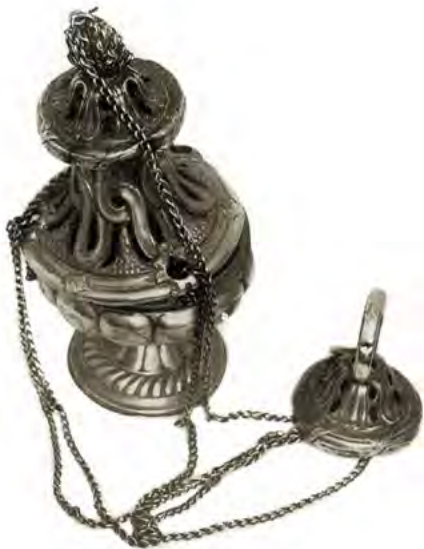
TRYBULARZ pocz. XVIII w. metal posrebrzany Kat. RH-645