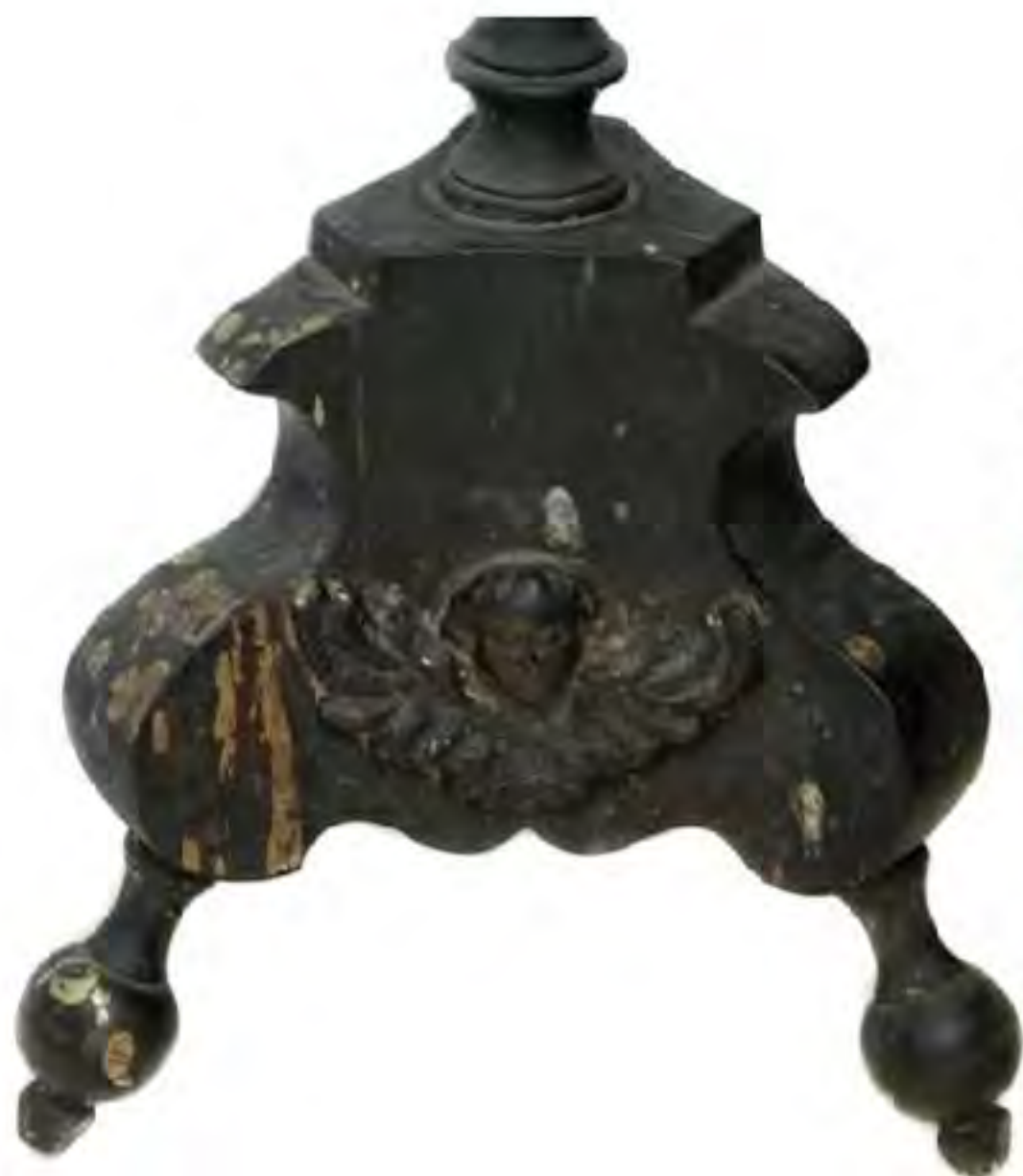
ŚWIECZNIK koniec XVIII w. Stop ołowiu, wys. 82 cm Kat. RL-372