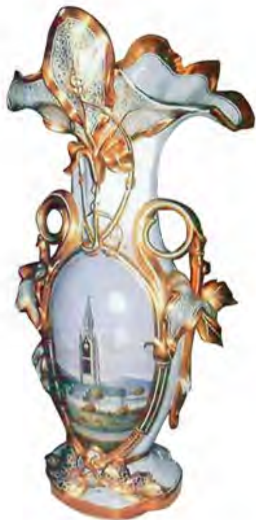
WAZA z miniaturą Poczdamu Wałbrzych, Śląsk Porcelana, wys. 80 cm Kat. RE-512