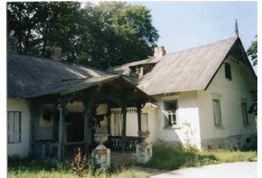
Mostowice. Zespół pałacowy Skirmunttów