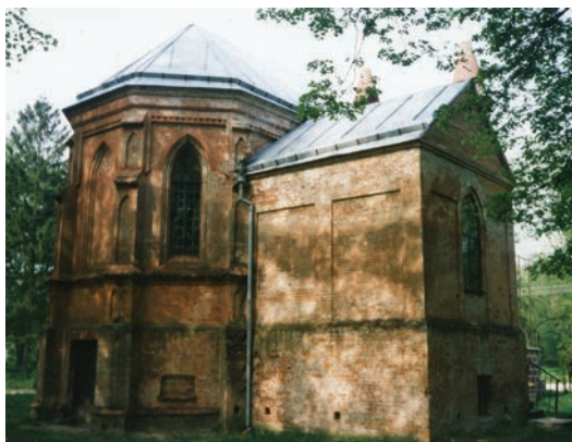
Skidel. Kaplica dworska z przełomu XIX i XX w.

nowego miasta Mosty położona jest wieś Mosty Prawe. Od XVI w. należała do ekonomii grodzieńskiej. Na wysokim brzegu Niemna wznosi się tu niezłe zachowany pałac, nie wiadomo przez kogo wzniesiony, zapewne na przełomie XIX i XX w. Jest to eklektyczna budowla parterowa, z piętrową częścią środkową. W elewacji głównej występuje portyk zwieńczony trójkątnym frontonem z okulusem. Kondygnacje rozdzielone wydatnym gzymsem. Od strony Niemna dwukolumnowy portyk dźwigający żeliwny balkon. Boczne skrzydła opilstrowane, z trójkątnymi frontonami, w zwieńczeniu fryz kostkowy. Do jednej z elewacji bocznych dobudowano przeszkloną rotundę nakrytą wysokim dachem namiotowym. Kiedyś być może mieściła kaplicę lub oranżerię. W 1997 r. pałac sprawiał wrażenie opuszczonego. W otoczeniu pozostał przetrzebiony park.