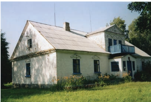
Dziergiele k. Zelwy. Dwór z początku XX w.