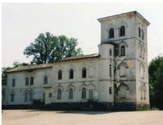
Tarnowszczyzna. Zespół pałacowy z przełomu XIX i XX w.