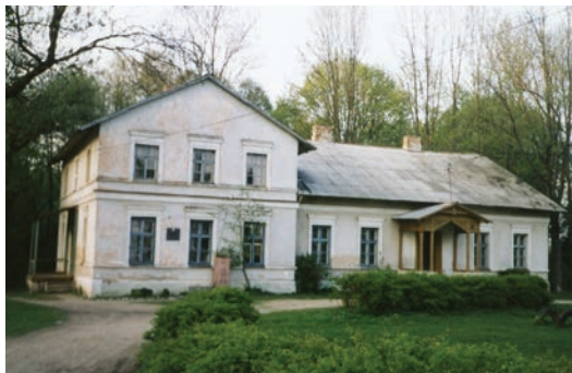
Białe Blota. Dawny dwór Tukattów z 2. poł. XIX w.