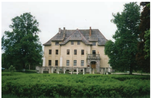
Świsłocz Górna. Modernistyczny pałac z końca XX w.