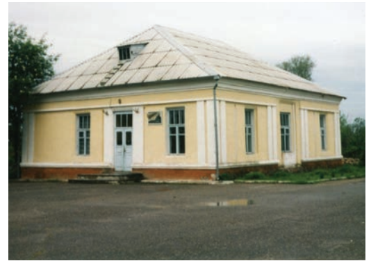
Łunna. Dawny zespół dworski Tarasewiczów

Iwanowska (na mapach białoruskich Haławiczpole). Jest tu bardzo dobrze utrzymany dwór modernistyczny, z elementami neogotyku. Wzniesiony w 1900 r. (lub w 1909 r.) Na mocy przywileju króla Zygmunta Starego z 1510 r. przez 350 lat dobra Dworzec były własnością potomków dworzanina królewskiego Iwaszcza Ryłło Bykowskiego. Później nazwę wsi zmieniono na Lebiodka (od źródeł pobliskiej rzeczki o tej nazwie). Od 2. poł. XIX w. do 1939 r. wieś należała do Iwanowskich. Ostatnim właścicielem był Stanisław Iwanowski (Polak). Jeden z jego braci, Jerzy, uważał się za Litwina, drugi, Wacław, był znanym białoruskim działaczem politycznym i społecznym. Dwór ma kształt litery L, nakryty jest wysokim dachem z lukarnami. Jedno ze skrzydeł jest parterowe, drugie – piętrowe. W ryzalitach występują spiczaste szczyty z pinaklami. Z czerwonym kolorem ceglanych ścian kontrastują otynkowane obramienia okien, drzwi i szczytów oraz boniowane naroża. W elewacji ogrodowej widoczny jest taras z kutą balustradą. Wewnątrz zachowały się stare piece. W 1999 r. we dworze mieścił się ośrodek dla upośledzonych dzieci. W otoczeniu dobrze utrzymany park krajobrazowy.