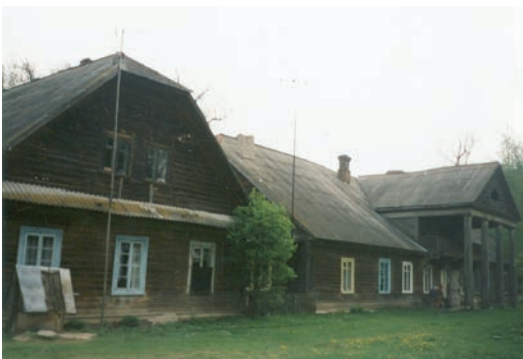
Kaszubińce. Dwór z 1870 r.