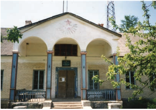
Gurnofel. Modernistyczny dwór z pocz. XX w.