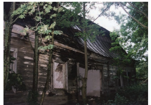
Borki. Pozostałości neobarokowego dworu Protasewiczów z pocz. XX w.