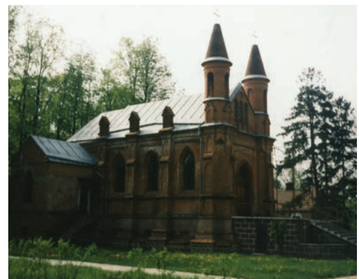
Skidel. Kościół parafialny