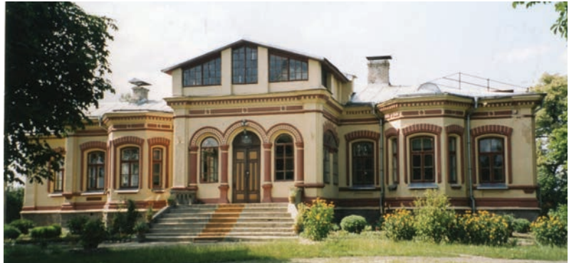
Aleksandrowszczyzna. Zalewy. Dwór z końca XIX w.