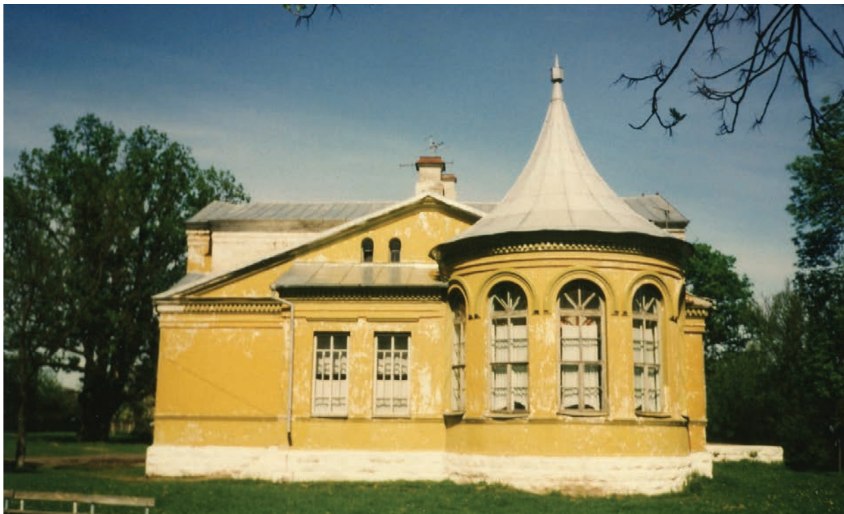
Mosty Prawe. Pałac wzniesiony na przełomie XIX i XX w. Obecnie opuszczony.