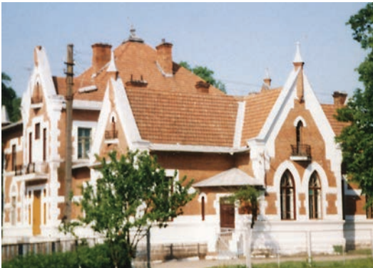
Lebiodka. Dwór modernistyczny z 1900 r.