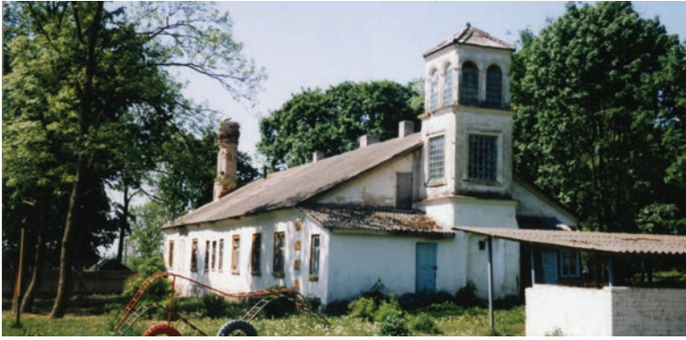
Lipniski. Dawny dwór Wolskich z 2. poł. XIX w.