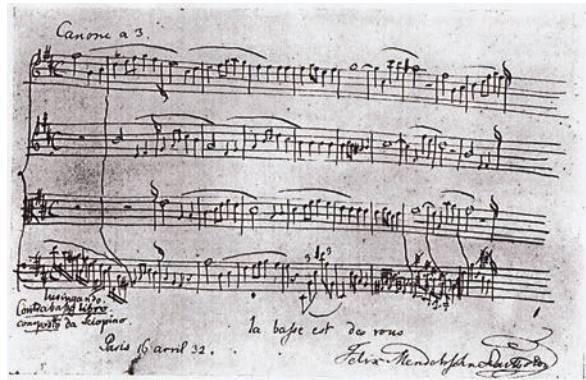
Autograf muzyczny Chopina Życzenia za: L. Binental Chopin. W 120 rocznicę urodzin.