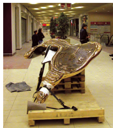
Instalacja rzeźby Salvadora Dali Profile of Time w Arkadach Wrocławskich.