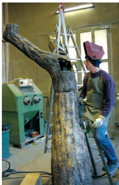
Odlewnia „Perseo” – obróbka odlanych elementów rzeźby