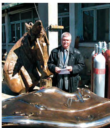
Autor artykułu w odlewni „Perseo” w Mendisio, w trakcie odbioru rzeźby.