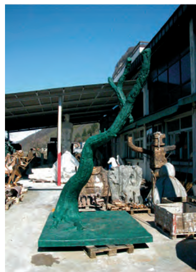
Rzeźba powstała w odlewni „Perseo”, w miejscowości Mendisio w Szwajcarii (niedaleko włoskiego Como) specjalizującej się w odlewach rzeźb Salvadora Dali.