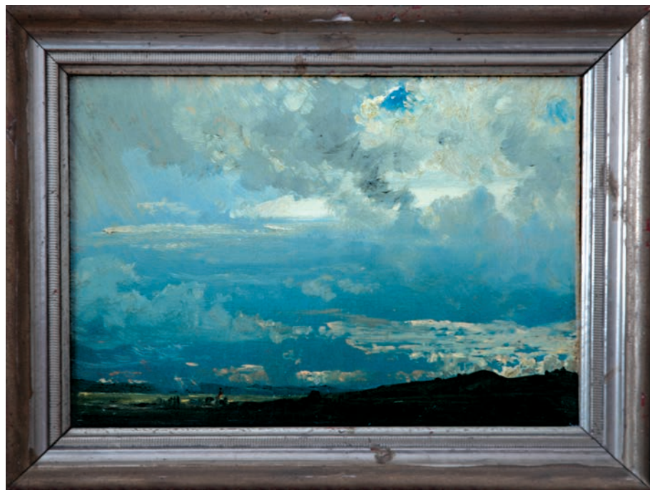
Friedrich Philipp Reinhold, Studium chmur . Fot. Jacek Miler

OPRAC. BARBARA KALETĄ INTERPOL. NAJBARDZIEJ POSZUKIWANE DZIEŁA SZTUKI