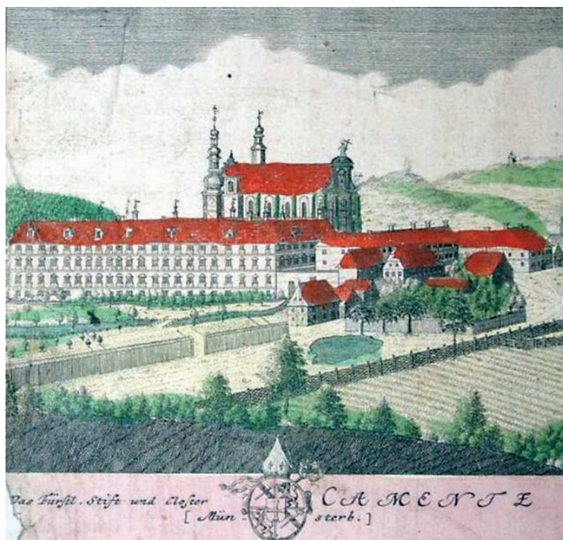
Kościół w Kamieńcu Ząbkowickim na starej rycinie.

Oficjalne przekazanie obrazu Friedricha Philippa Reinholda, zaginionego na skutek II wojny światowej, nastąpiło 23 czerwca 2008 r. Minister kultury i dziedzictwa narodowego Bogdan Zdrojewski przekazał odzyskane dzieło sztuki na ręce Mariusza Hermansdorfera, dyrektora Muzeum Narodowego we Wrocławiu. Przez jakiś czas będzie ono eksponowane na sztalugach w osobnej sali, a później znajdzie swoje miejsce na wystawie stałej wśród eksponatów sztuki zachodnioeuropejskiej.