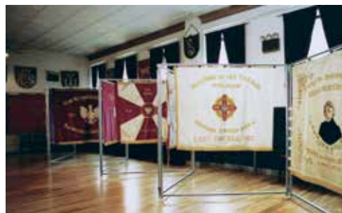
Ekspozycja historycznych sztandarów w Muzeum Tradycji Oręża Polskiego w Nowym Jorku