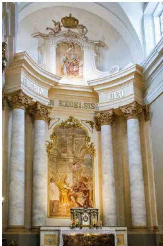
Krastaw (Łotwa) – ołtarz główny w kościele parafialnym pw. św. Ludwika

Do najbardziej aktywnych beneficjentów programu „Ochrona dziedzictwa kulturowego za granicą” należą organizacje pozarządowe. Bez ich bezinteresownego zaangażowania w prace