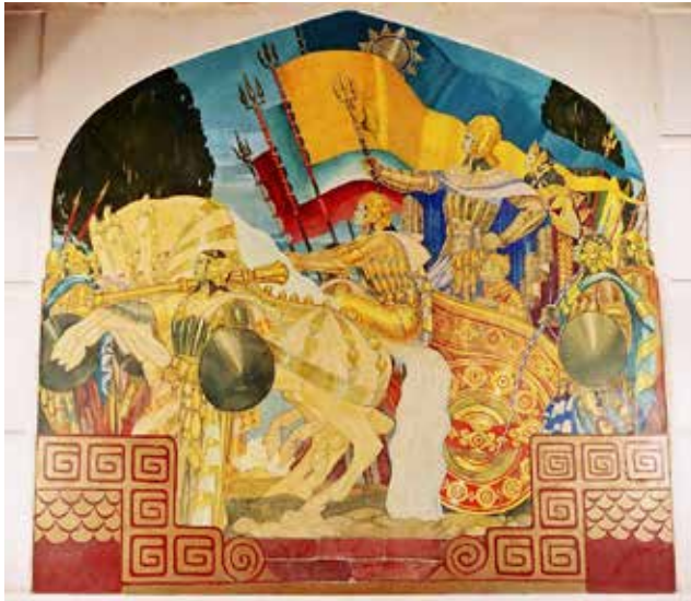
Džodpur (Indie) – malowidło Stefana Norblina w Sali Orientalnej pałacu maharadzów