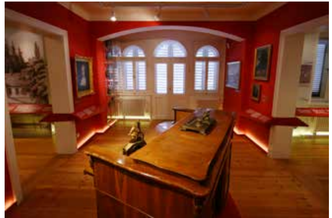
Drezno (Niemcy) – Muzeum Józefa Ignacego Kraszewskiego

Po największym, zrealizowanym poza krajem projekcie muzealniczym, jakim było otwarcie w 2004 r. odrestaurowanego i wyposażonego ze środków MKiDN dawnego dworu Słowackich w Krzemieńcu (Ukraina), mieszczącego Muzeum Juliusza Słowackiego, przyszła pora na realizację kolejnych przedsięwzięć. Powstały nowe wystawy stałe w Muzeum Józefa Ignacego Kraszewskiego w Dreźnie i Muzeum Adama Mickiewicza w Stambule, a w 2015 r. uroczyście otwarto Muzeum Josepha Conrada Korzeniowskiego w Berdyczowie. Trwają prace nad stałą ekspozycją poświęconą Ignacemu Domeyce w La Serena (Chile). We wrześniu 2017 r. zaplanowano otwarcie Muzeum Witolda Gombrowicza w Vence (Francja).