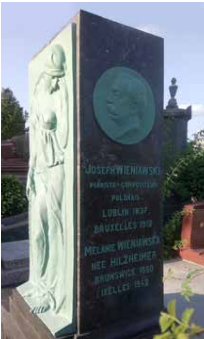
Bruksela (Belgia) – nagrobek Józefa Wieniawskiego na cmentarzu Ixelles