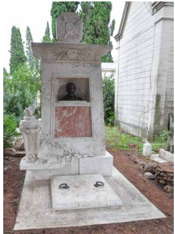
Rzym (Włochy) – Grób Artystów Polskich na Campo Verano