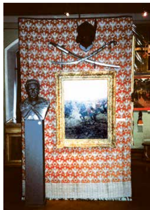
Fragment ekspozycji w zbiorach Muzeum Polskiego w Rapperswilu

Obecnie liczbę Polaków poza granicami kraju ocenia się na około 20 mln osób. Polska diaspora znajduje się na czwartym miejscu pod względem liczebności wśród innych diaspor świata (po Chińczykach, Rosjanach i Włochach). Niemal połowa obecnej Polonii mieszka w USA, a głównymi skupiskami Polaków, tym kraju są miasta: Chicago, Detroit, Nowy Jork. Na drugim miejscu znajduje się Polonia w Niemczech (ok. 2 mln osób), z takimi ośrodkami jak Berlin, Hamburg czy Zagłębie Ruhry. Ponad milionowa rzesza Polaków zamieszkuje też w Brazylii (głównie stan Parana z ośrodkiem w Kurytybie), na Ukrainie (z ośrodkami we Lwowie i w obwodzie żytomierskim), we Francji (ze skupiskami w Paryżu i północno-wschodnich rejonach kraju) i na Białorusi, gdzie ośrodkiem polskim jest Grodno, a także zachodnie rejony Białorusi. Polonia kanadyjska liczy ponad 800 tys. osób, a centrami życia Polaków w tym kraju są: Toronto, Montreal, Vancouver. Kilkusettyśięczne grupy Polaków zamieszkują też takie kraje, jak: Federacja Rosyjska, Ar-