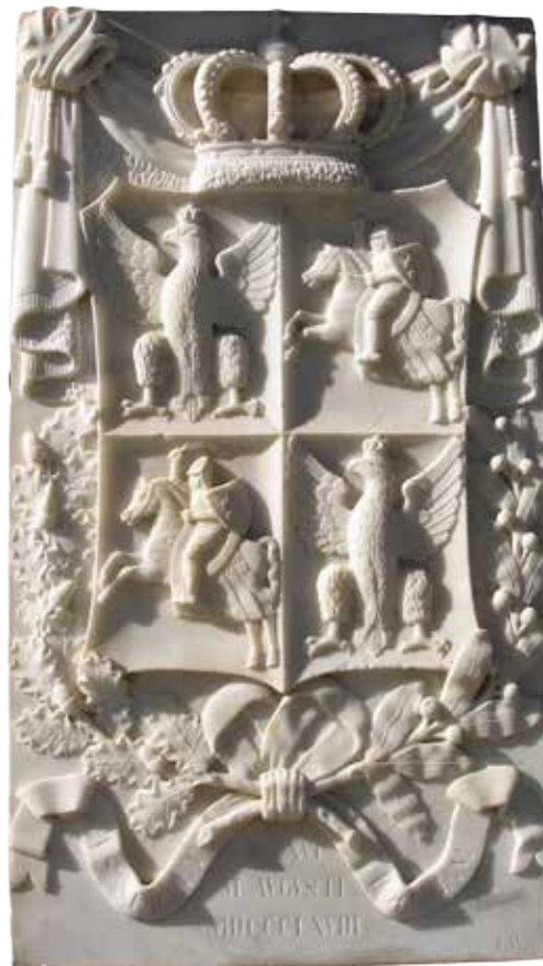
Rapperswil (Szwajcaria) – Polska Kolumna Wolności (Kolumna Barska) przy wejściu do Muzeum Polskiego na zamku raperswilskim, detal

Od 1 sierpnia 2016 r. w wyniku przyjęcia przez Sejm znowelizowanej ustawy o Instytucji Pamięci Narodowej i tym samym likwidacji Rady Ochrony Pamięci Walk i Męczeństwa, jej zadania, związane z ochroną polskich miejsc pamięci, grobów i cmentarzy wojennych znajdujących się poza krajem, przejął Minister Kultury i Dziedzictwa Narodowego. Powierzył je Departamentowi Dziedzictwa Kulturowego za Granicą i Strat Wojennych. Do głównych zadań w tym zakresie należy: opieka nad cmentarzami, prowadzenie bieżących prac remontowych i konserwatorskich, budowa nowych upamiętnień i cmentarzy, poszukiwanie i ekshumacje poległych i zamordowanych,