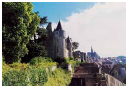
Zamek w Montrésor. Siedziba Muzeum