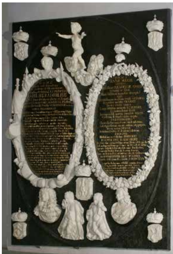
Kaliningrad (Rosja) – epitafium Bogusława Radziwiłła i jego żony Anny Marii w katedrze królewieckiej