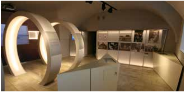
Berdyczów (Ukraina) – Muzeum Josepha Conrada Korzeniowskiego