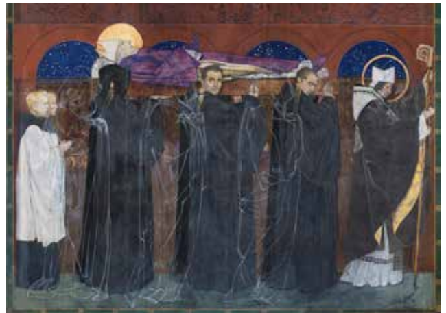
Lwów (Ukraina) – malowidło Jana Henryka Rosena, Pogrzeb św. Odilona w katedrze ormiańskiej

Kolekcje gromadzone na emigracji najczęściej nie mają jednolitego charakteru. Wśród zbiorów archiwalnych i bibliotecznych zdarzają się stare druki, cenne rękopisy czy listy