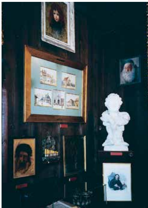
Fragment ekspozycji Judaików w zbiorach Muzeum Polskiego w Rapperswilu

(1815-1817) spędził w Szwajcarii. W miejscu jego pobytu, w miasteczku Solothurn, ufundowano w latach 30. XX w. przy wsparciu władz polskich Muzeum im. Tadeusza Kościuszki. Środki na jego zorganizowanie pozyskiwano m.in. z wpływów z koncertów światowej sławy polskiego pianisty, a także premiera rządu w II Rzeczypospolitej, Ignacego Paderewskiego. Podobnie jak Muzeum w Rapperswilu placówka ta działa z powodzeniem do dnia dzisiejszego.