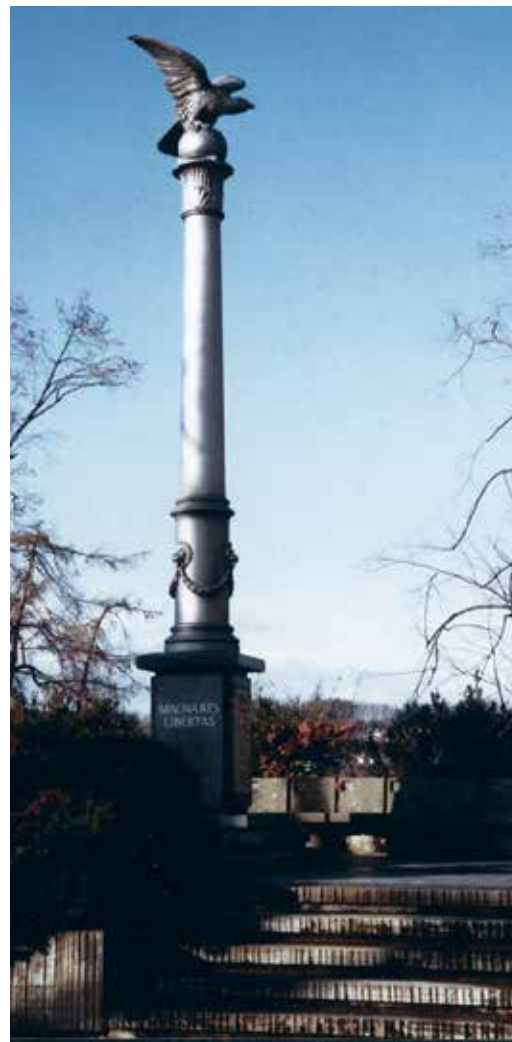
Kolumna barska ufundowana w 1868 r. przed wejściem do Muzeum Polskiego w Rapperswilu

Upadek powstania styczniowego był powodem kolejnej fali odpływu Polaków do innych krajów. Do Rosji wywieziono 40 tys. osób. Ponad 5 tys., uciekając przed prześladowaniami politycznymi władz zaborczych, wybrało emigrację do Francji, Stanów Zjednoczonych, Turcji, Szwajcarii, Włoch, Belgii oraz Anglii. Wielu z nich włączyło się w działania na rzecz odzyskania niepodległości przez Polskę w swoich nowych ojczyznach. Powstawały kolejne polskie instytucje gromadzące pamiątki narodowe. Jedną z istotnych dla kultury polskiej inicjatyw było założenie Muzeum Polskiego w Rapperswilu w Szwajcarii, co nastąpiło z inicjatywy Władysława hr. Broel-Platera. Założyciel tej placówki przekazał je w końcu XIX w. na własność narodowi polskiemu. Rapperswil stał się w okresie braku