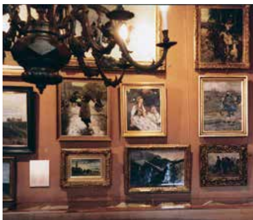
Fragment ekspozycji ze zbiorów malarstwa w Muzeum polskim w Rapperswil