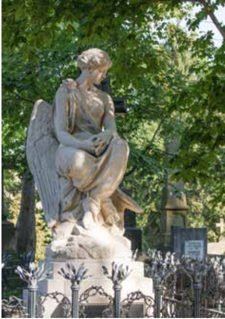
Lwów (Ukraina) – nagrobek rodziny Krówczyńskich na Cmentarzu Łyczakowskim, fot. Dorota Janiszewska-Jakubiak

królewskie, ale najczęściej są to dokumenty i wydawnictwa, poprzez które prześledzić możemy działalność instytucji emigracyjnych i organizacji polonijnych. W bibliotekach znajdziemy głównie publikacje autorów XIX- i XX-wiecznych oraz współczesnych. Muzealia zgromadzone przez te instytucje to przede wszystkim pamiątki historyczne – przedmioty związane z wybitnymi postaciami polskiej emigracji, twórcami kultury, działaczami społecznymi, weteranami kolejnych powstań i wojen. Często są to obiekty o niewielkiej wartości antykwarycznej, natomiast dla nas są to bezcenne świadectwa naszej historii i losów Polaków, mające duży ładunek emocjonalny.