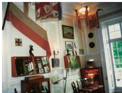
Sala wystawowa w Instytucji polskim i Muzeum im. gen. Sikorskiego w Londynie