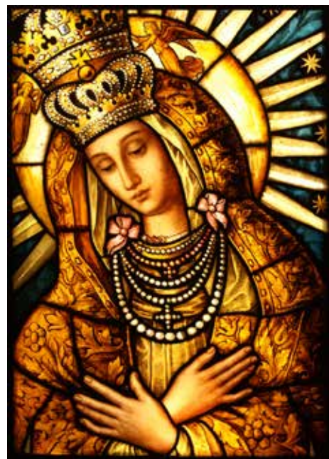
Lwów (Ukraina) – fragment witraża Święci Patroni w katedrze tacińskiej, fot. Ewelina Kędziewska