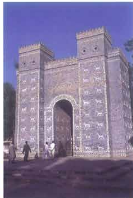
▲ Rekonstrukcja Bramy Isztar w Babilonie

Działania zbrojne na Bliskim Wschodzie są jedną z przyczyn zniszczenia dóbr kultury w tym regionie, ale i tu nie one bezpośrednio powodują największe straty. Zagrożenia dziedzictwa na szeroką skalę są wspólne dla całego regionu. Pośród przyczyn należy wymienić m.in. eksplozję demograficzną, pociągającą za sobą