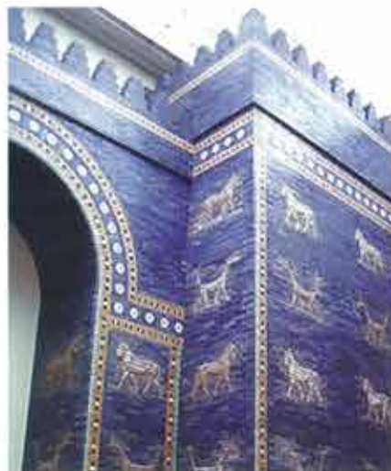
▲ Brama Isztar zrekonstruowana w Muzeum Pergamońskim w Berlinie

Działania zbrojne na Bliskim Wschodzie są jedną z przyczyn zniszczenia dóbr kultury w tym regionie, ale i tu nie one bezpośrednio powodują największe straty. Zagrożenia dziedzictwa na szeroką skalę są wspólne dla całego regionu. Pośród przyczyn należy wymienić m.in. eksplozję demograficzną, pociągającą za sobą