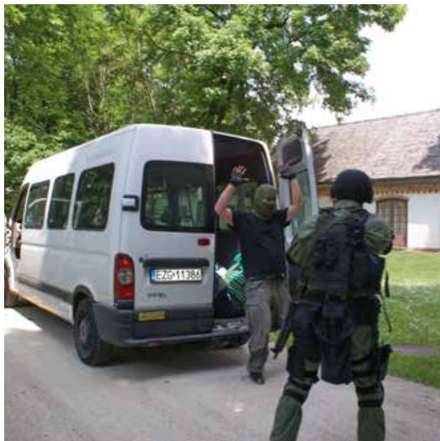
Zdjęcie ze szkolenia dotyczącego zasad postępowania w razie ataku terrorystycznego na instytucję kultury; szkolenie odbyło się w czerwcu 2015 r. na terenie Domu Pracy Twórczej w Radziejowicach

Polska od wielu lat aktywnie uczestniczy w wielu międzynarodowych projektach dotyczących zagrożonego dziedzictwa kultury. W latach 2003-2008 i 2010-2012 polscy eksperci brali udział w realizacji projektów ochrony dziedzictwa kultury w Iraku i Afganistanie. Doświadczenia z ich pracy w warunkach wojennych są niezwykle cenne i warte wykorzystania. Dlatego też