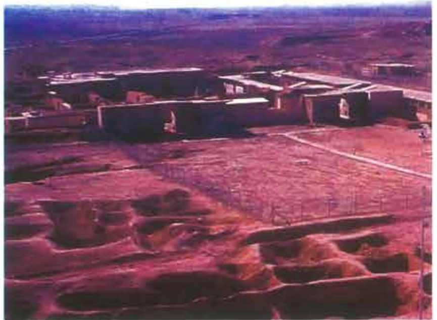
▲ Widok na ruiny pałacu w Nimrud

Działania wojenne dokonały nie tylko bezpośrednich zniszczeń. Wytworzyły także sytuację sprzyjającą innemu rodzajowi zagrożeniom: dewastacji, kradzieży, przemytowi czy też – podobnie było w 1991 r. – stratom spowodowanym brakiem środków i ekspertyzy.