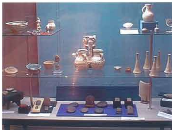
▶ Asyryjska ceramika w muzeum w Bagdadzie

gwałtowny rozwój ośrodków urbanistycznych, rozrastanie się infrastruktury w regionie, gdzie niemal każdy metr kwadratowy podłoża może zawierać cenne świadectwa historii – bez uwzględnienia ochrony dziedzictwa. To niedostatek potęgujący problem nielegalnego handlu dobrami kultury. To brak wody, na który klasyczną odpowiedzią jest konstrukcja zapór. Rozpoczęto budowę zapory na Tygrysie, mającej spowolnić zalanie części asyryjskiego miasta Aszur. Wojna przerwała konstrukcję. Można żywić nadzieję, iż w planach odbudowy Iraku zostanie przewidziane alternatywne rozwiązanie. ♦