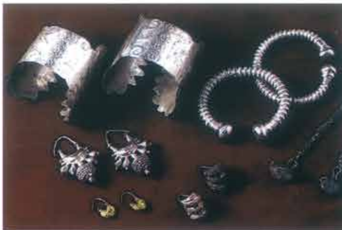
◀ Biżuteria z Aszur

13-osobowa ekipa wojskowych i celników amerykańskich przystąpiła do inwentaryzacji zbiorów Muzeum Bagdadzkiego. Nie udało się sporządzić wyczerpującego inwentarza, ponieważ większa część kolekcji została stopniowo przeniesiona do podziemi Banku Centralnego Iraku, gdzie spoczywa skarb z Nimrud, do tajnego schronu używanego w tym celu już od 1990 r. oraz magazynów muzeum. Personel muzeum zobowiązał się dostarczyć katalog dóbr ukrytych w schronie, natomiast lokalizacja zostanie ujawniona, gdy powstanie nowy rząd iracki. Nie wiadomo, czy to miejsce jest nienaruszone. Skarb z Nimrud, zawierający 616 przedmiotów, jest nadal zapieczętowany, choć podziemie banku zostało splądrowane. W innej galerii podziemia znajdowało się prawie 7 tys. przedmiotów, w tym złotej biżuterii i przedmiotów użytkowych wykonanych z cennego kruszcu, do których dotarli złodzieje. Odzyskano 951. Jednym z nich jest najstarszy znany odlew z brązu.