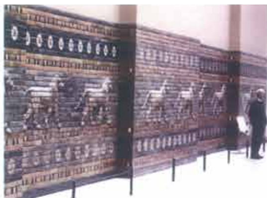
▲ Fragmenty fryzu mozaikowego z Babilonu, obecnie w Muzeum Pergamońskim w Berlinie

W marcu i kwietniu ubiegłego roku 200 bojowników przez czterdzieści dni okupowało Bazylikę Narodzenia w Betlejem, stawiając opór wojsku izraelskiemu. Szkody, według szacunków palestyńskich służb konserwatorskich, są na szczęście niewielkie, rzędu kilku tysięcy dolarów. Bazylika ucierpiała bardziej wskutek zajęcia przez 200 osób niż z powodu działań zbrojnych. Natomiast bitwa w Nablus przyniosła znaczne straty w historycznym centrum miasta, gdzie czołgi dokonały zniszczenia wielu zabytkowych zabudowań. Z powodu godziny policyjnej misja UNESCO nie miała możliwości, by udać się na miejsce wydarzeń i ocenić straty. Utraty zabudowań, zabytkowych domów z epoki otomańskiej, uniknięto w Hebronie. Nie były one zagrożone konfliktem zbrojnym, lecz planowaną konstrukcją drogi wiodącej z kolonii w pobliżu Hebronu do Grobowca Patriarchów w centrum miasta. Palestyński Komitet Rehabilitacji Hebronu odwołał się do Sadu Najwyższego Izraela, który nie zezwolił na realizację projektu w tej postaci.