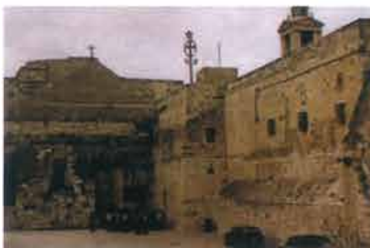
▲ Wejście do Bazyliki Narodzenia w Betlejem

Nawiązane zostały kontakty z władzami państw graniczących z Irakiem, Interpolem, służbami celnymi, by ograniczyć handel dobrami kultury tego kraju. W 1991 r. cztery tysiące przedmiotów uległo kradzieży. Irak przygotował katalog przesłany Sotheby's oraz wszystkim organizacjom działającym na rzecz