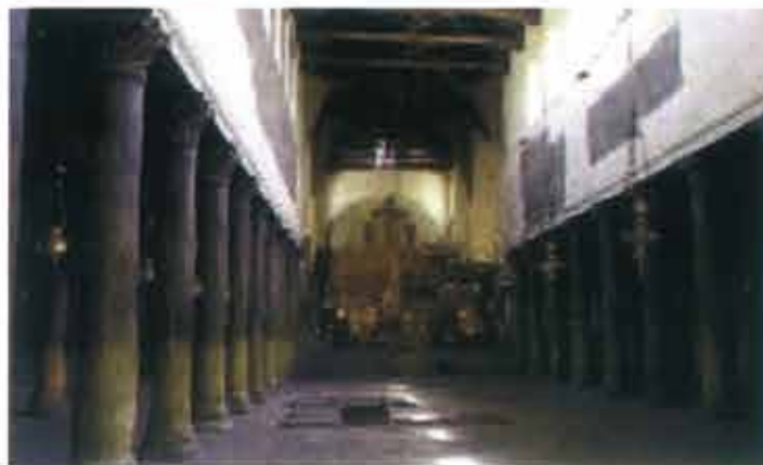
▶ Wnętrze Bazyliki Narodzenia w Betlejem