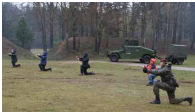
Zdjęcie ze szkolenia ekspertów ochrony dziedzictwa kultury w Centrum Przygotowań do Misji Zagranicznych w Kielcach

nasi eksperci są gotowi do współdziałania w realizacji projektów międzynarodowej ochrony zagrożonego dziedzictwa kultury. Polscy naukowcy z Uniwersytetu Warszawskiego, jako pierwsi zagraniczni eksperci, brali udział w akcji ratowania zbiorów z ruin syryjskiej Palmyry w kwietniu 2016 r. Należy też pamiętać o naszej stałej aktywności na forum UNESCO w tym obszarze, co znalazło swój wyraz w organizacji w dniach 23-24 listopada 2016 r. przez Ministerstwo Kultury i Dziedzictwa Narodowego przy wsparciu Polskiego Komitetu Błękitnej Tarczy międzynarodowej konferencji „Dziedzictwo kultury wobec współczesnych zagrożeń i wyzwań. Programy i kierunki działań”, w wyborze Krakowa na miejsce 41. sesji Komitetu Światowego Dziedzictwa w lipcu 2017 r. oraz w planowanej na 2018 r. konferencji międzynarodowej poświęconej problemom odbudowy po zniszczeniach wojennych i zdarzeniach losowych, które dotyczą miejsc światowego dziedzictwa.