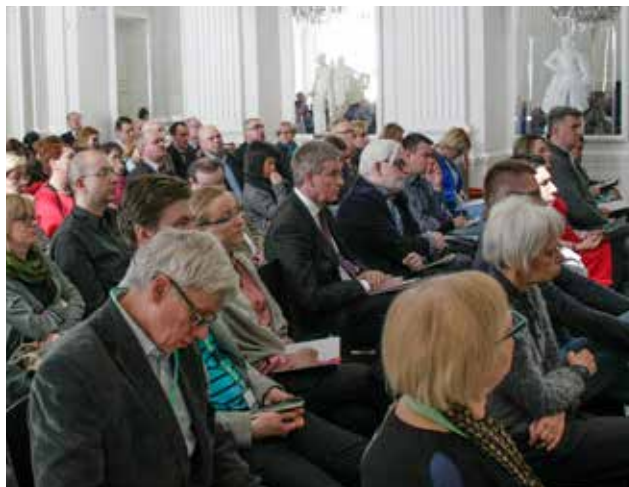
Seminarium „Dziedzictwo wobec współczesnych zagrożeń i wyzwań. Program działań”, zorganizowane w ramach cyklu „Bezpieczeństwo (w) muzeum” w dn. 26 kwietnia 2016 r. w Muzeum Pałacu Króla Jana III w Wilanowie, we współpracy z Polskim Komitetem Błękitnej Tarczy, ICOM Polska oraz Narodowym Instytutem Muzealnictwa i Ochrony Zbiorów

● W dniu 1 listopada 2016 r., podczas otwarcia wystawy poświęconej dziedzictwu Mezopotamii w Lens, prezydent François Hollande zaproponował, żeby zabytki Iraku i Syrii oraz inne dobra kultury narażone na zniszczenia wojenne przechować na terenie Francji. Mogłyby one trafić jako depozyt do magazynu Oddziału Muzeum Luwr w Lens, położonego 200 km na północ od Paryża. Główną rolą placówki w Lens będzie przechowanie tej części kolekcji Muzeum Luwr, która nie jest wystawiana w Paryżu. Może też ona odegrać inną rolę,