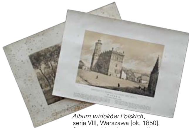
Album widoków Polskich, seria VIII, Warszawa [ok. 1850]. Stan przed i po konserwacji. Fot. ze zbiorów WBP w Lublinie