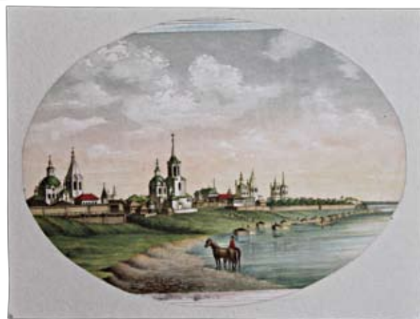
„Syberja 1864-1869”. Stan po konserwacji

W trakcie wstępnych prac konserwatorskich przeprowadzono dezynfekcję wymienionych obiektów w oparach para-chloro-meta-krezolu. Zabezpieczono niestabilne pigmenty oraz krawędzie przed uszkodzeniami w dalszych zabiegach, a następnie strukturę papierowego podłoża poddano wieloetapowemu czyszczeniu oraz odkwaszeniu. W dalszej kolejności przystąpiono do głównych prac restauratorskich, w trakcie których uzupełniono bibulką japońską ubytki papieru, wzmocniono jego strukturę i miejsca uszkodzone mechanicznie. Fotografie, rysunki, akwarele i litografie uzyskały stabilniejsze podłoża oraz – w przypadku najbardziej zniszczonych fragmentów – nową aranżację. Wszystkie obiekty zostały umieszczone w specjalnych tekach ochronnych oraz opatrzone dokumentacją opisową i fotograficzną z przeprowadzonych prac. Podstawowy cel, jakim było przywrócenie walorów estetycznych i użytkowych opisywanym zbiorom oraz właściwe przygotowanie ich do przechowywania i ekspozycji – został zatem osiągnięty.