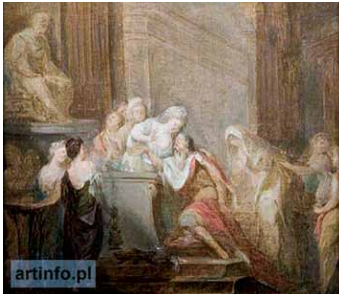
Poświęcenie świątyni. Reprodukacja szkicu olejnego Marcello Bacciarellego Salomon otoczony niewiastami cudzoziemskimi, składa ofiary bogom pogańskim publikowana na stronie artinfo.pl