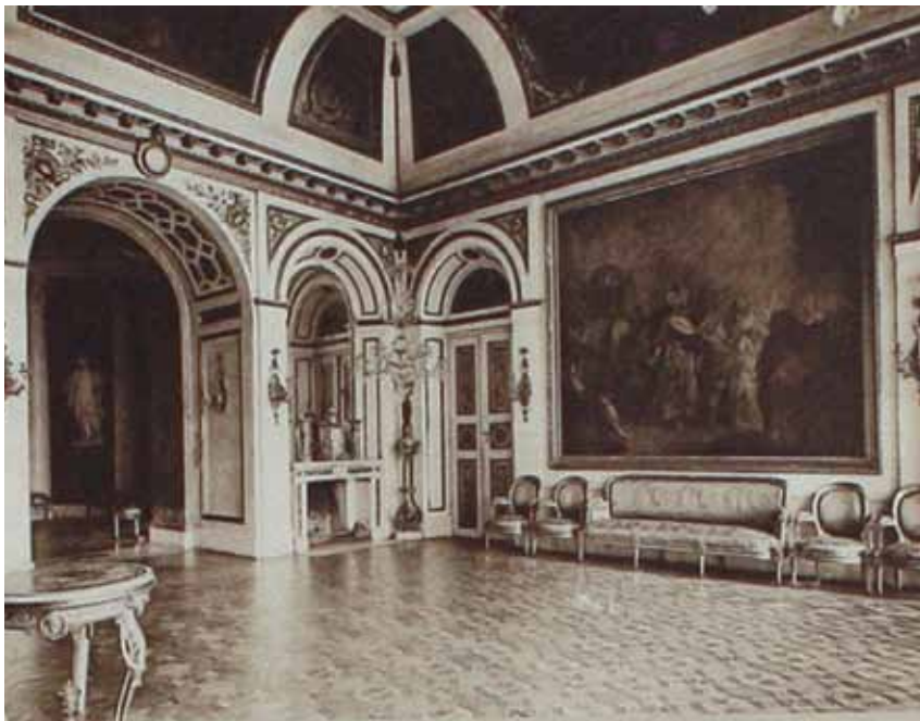
Widok Sali Salomona sprzed 1939 roku.

W 1870 r. zakupił on zbiór obejmujący m.in. 262 obrazy oraz 7000 rysunków i rycin, by jeszcze w tym samym roku przekazać wszystko w darze Poznańskiemu Towarzystwu Przyjaciół Nauk. 2