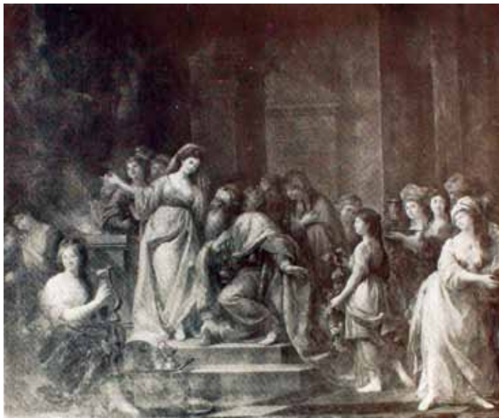
Przedwojenne zdjęcie malowidła Marcello Bacciarellego Ofiara Salomona ze wschodniej ściany Sali Salomona w Patacu na Wodzie .