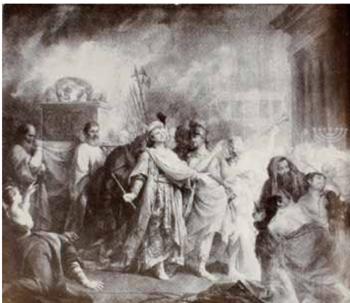
Przedwojenne zdjęcie malowidła Marcello Bacciarellego Poświęcenie Świątyni Jerozolimskiej przez Salomona z zachodniej ściany Sali Salomona w Patacu na Wodzie