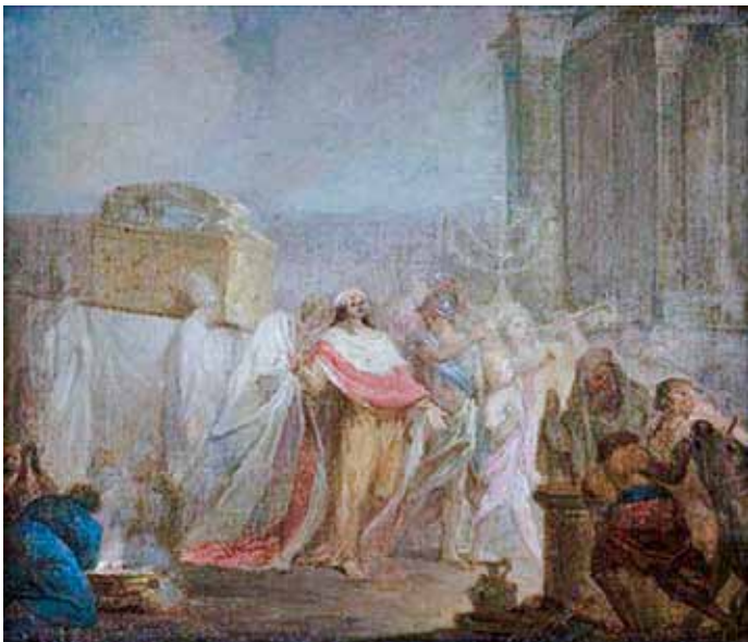
Ofiara Salomona. Reprodukacja szkicu olejnego Marcello Bacciarellego Poświęcenie Świątyni Jerozolimskiej przez Salomona , publikowana na stronie artinfo.pl