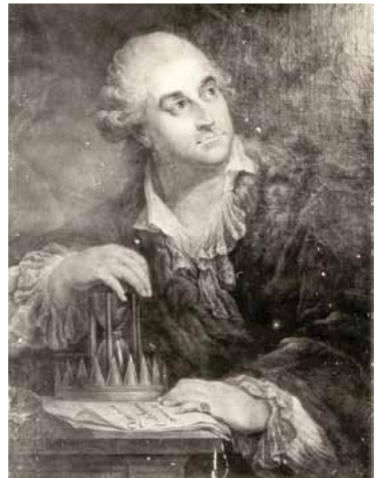
Zaginiony z przedwojennych zbiorów Towarzystwa Zachęty Sztuk Pięknych w Warszawie Portret Stanisława Augusta Poniatowskiego z klepsydrami autorstwa Marcello Bacciarellego.