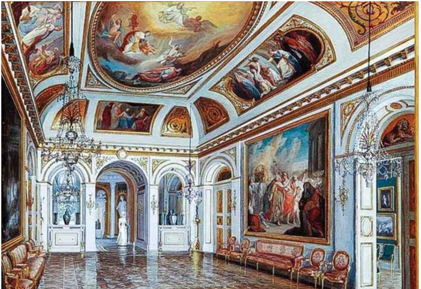
Gwaz Ludomira Franciszka Dymitrowicza ze zbiorów Muzeum Łazienek Królewskich w Warszawie ilustrujący wygląd Sali Salomona w roku 1892.