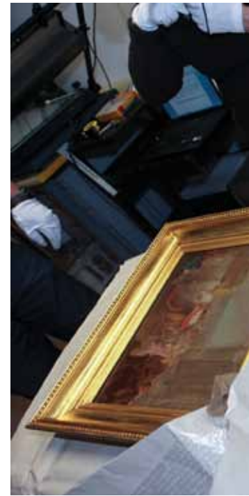
Oględziny obrazów w Muzeum Narodowym w Poznaniu po ich zabezpieczeniu 10 stycznia 2013.

dze zbiorów świadczy ich obecność na wszystkich ważniejszych (zwłaszcza tych ukazujących malarstwo w ujęciu historycznym) wystawach XIX i XX w., a także trwałe miejsce w literaturze historyczno-artystycznej”. Szkicom Bacciarellego w inwentarzu Towarzystwa przyporządkowano następujące numery: TPN 165 – Salomon otoczony niewiastami cudzoziemskimi, składa ofiary bogom pogańskim , TPN 166 – Poświęcenie Świątyni Jerozolimskiej przez Salomona . Odnotowano je później w katalogach zbiorów Towarzystwa w latach 1881, 1889 i 1912. 3