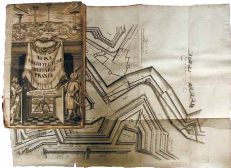
Ch. Neubaurn, Vera architecturae militaris Praxis (Stargard in Pommern 1679)