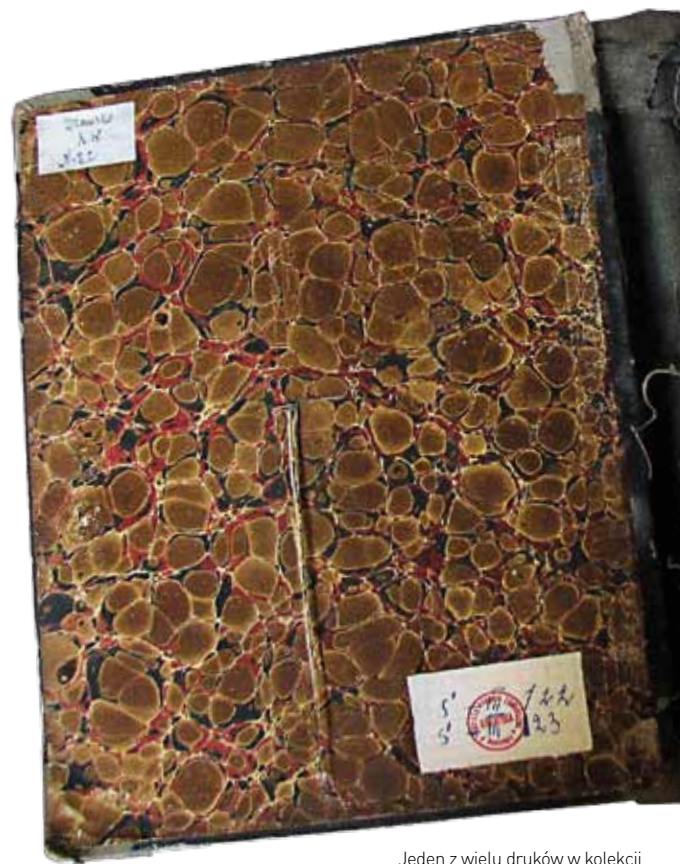
Jeden z wielu druków w kolekcji