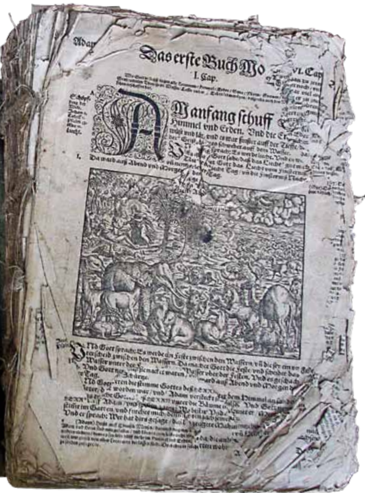
BMNS wymagający konserwacji - Biblia (Frankfurt am Mayn 1564)