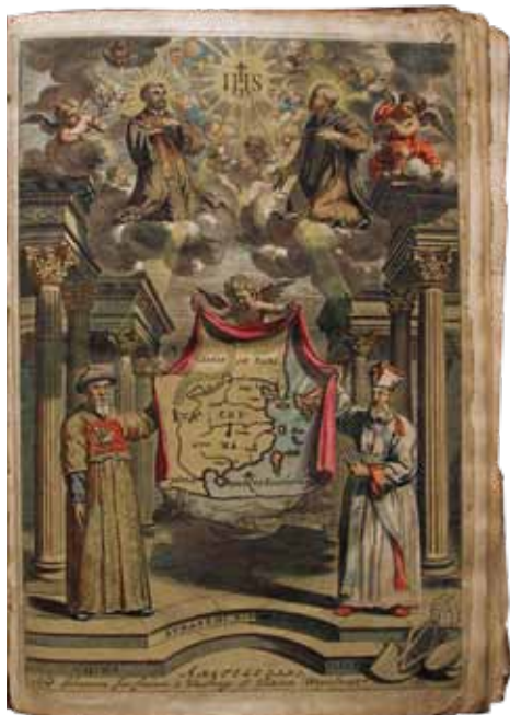
A. Kircher, J. Grueber, La Chine (Amsterdam 1670)