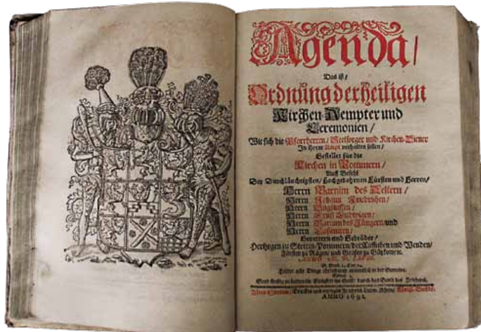
Agenda ... gestellet vor de Kercken in Pamern (Alten Stettin 1691). Na karcie przedtytułowej herb książąt pomorskich

nik po antycznych zabytkach Rzymu – De urbis antiquitatibus libri quinque Romae (Rom 1545) Andrei Fulviusa (1470–1527), znanego kolekcjonera i znawcy starożytności; jedno pierwszych pogłębionych studiów, dokumentujące zabytki starożytności.