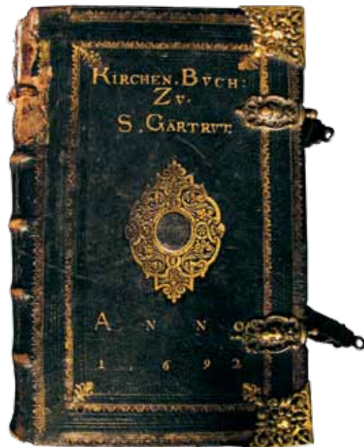
Agenda ... gestellet vor de Kercken in Pamern (Alten Stettin 1691). Własność kościoła św. Gertrudy w Dartowie, druk zakupiony w 1692 r.