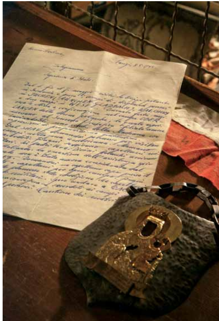
List biskupa Józefa Gawliny do papieża Piusa XII wraz z załączonymi darami dla papieża od Polek wyzwolonych ze Stalagu V1.C Oberlangen.

„Konkordat z Wormacji” pomiędzy cesarzem Henrykiem V a Kaliksem II (1122 r.) utrwalał na dwieście lat dominację papie-