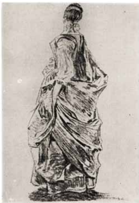
Antoine Watteau (1684–1721), Stojąca kobieta zwrócona bokiem, Gabinet Rycin BUW, Zbiór Stanisława Kostki Potockiego.

4132 rękopisy oraz 103 604 rysunki i ryciny).