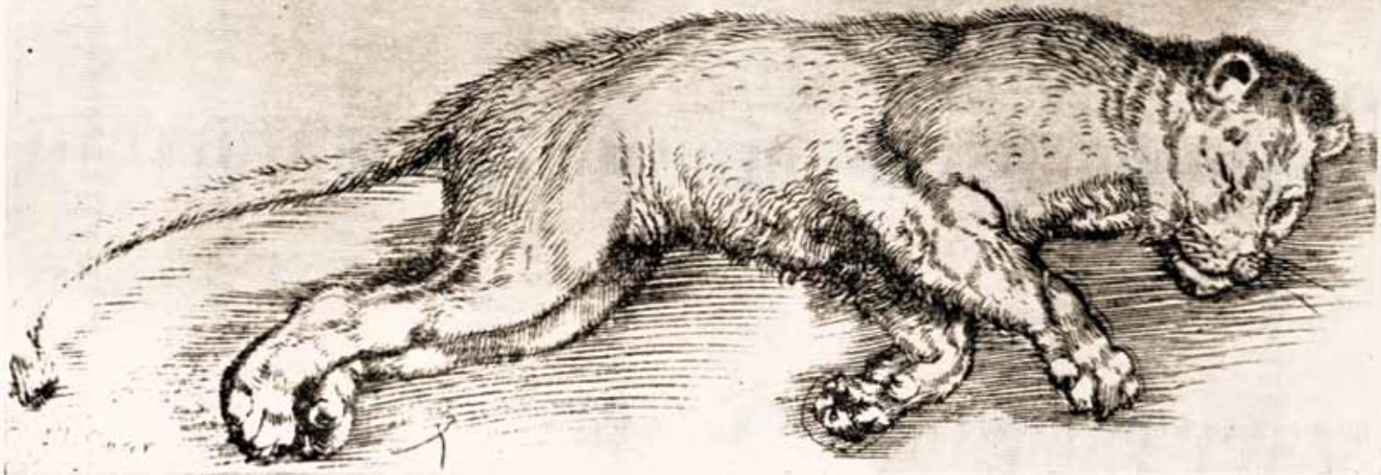
Albrecht Dürer (1471–1528), Leżąca lwica , Gabinet Rycin BUW, Zbiór Królewski Stanisława Augusta.