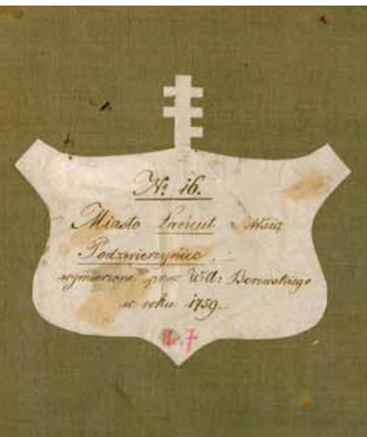
Fragment okładki mapy z herbem Pilawa, podpisem i numerami inwentarzowymi