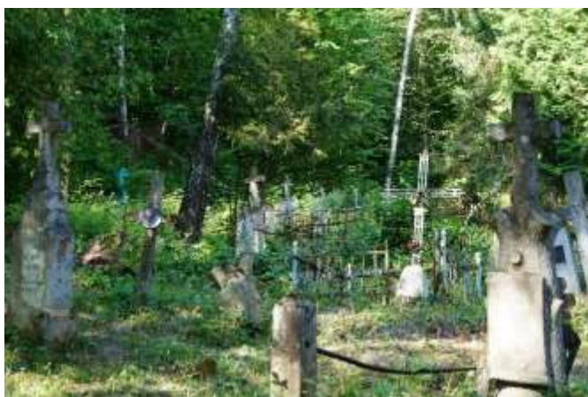
Porządkowanie Cmentarza Polskiego w Krzemieńcu, Stowarzyszenie Odra-Niemen, dofinansowanie 44900 zł