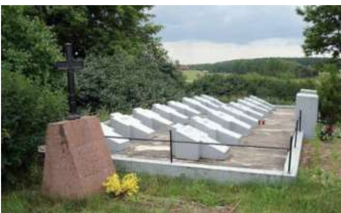
Pamięci Okręgu Wileńskiego ZWZ-AK, Stowarzyszenie Łągierników Żołnierzy Armii Krajowej, dofinansowanie 30000 zł