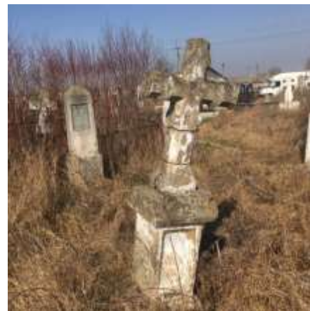
Wolontariat dla Kresów - Bolszowce i Podilla, Fundacja Brat Słońce, dofinansowanie 25000 zł. Projekt rozpoczęty, zrealizowana część przygotowawcza, niestety zamknięcie granic z Ukrainą uniemożliwiła młodzieży wyjazd na obóz wolontariacki. Zdjęcie z zeszłorocznej edycji projektu.

Uczestnictwo w działaniach wolontariackich za granicą, to nie tylko możliwość obcowania z historią, to też ogromna satysfakcja z możliwości dołożenia własnej cegiełki na rzecz ochrony wspólnego dziedzictwa. To okazja do poznania tajników konserwacji zabytków, świetna forma edukacji kulturowej oraz możliwość odwiedzenia miejsc, w które najprawdopodobniej nigdy by się nie dotarło, gdyż zwykle nie leżą one na szlakach turystycznych. W wielu wypadkach praca w ramach tego programu umożliwia odnalezienie cennych obiektów, które następnie mogą być poddane profesjonalnej renowacji konserwatorskiej w ramach działań Instytutu POLONIKA oraz dzięki dotacjom programu Ministra Kultury i Dziedzictwa Narodowego Ochrona dziedzictwa kulturowego za granicą .