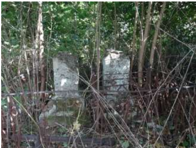
Dziedzictwo Tadeusza Czackiego w Krzemieńcu. Porządkowanie cmentarza bazylikańskiego w Krzemieńcu na Ukrainie jako element wzmocnienia wspólnoty Liceum Krzemienieckiego, Towarzystwo Tradycji Akademickiej, dofinansowanie: 29000 zł