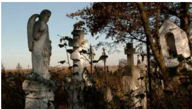
Inskrypcje Kresowe ..., Stowarzyszenie „CRAS” Centrum Rozwoju Aktywności Społecznej, dofinansowanie 20000 zł