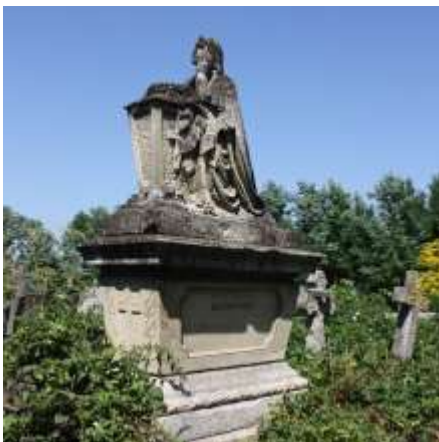
Ormiański wolontariat na Kresach - prace inwentaryzacyjne i porządkowe na cmentarzach w Śniatynie i Kutach, Fundacja Armenian Foundation, dofinansowanie 25 000 zł