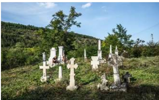
Prace inwentaryzacyjno-porządkowe na polskich cmentarzach w separatystycznym Naddniestrzu (Mołdawia): Raszków i Jahorlik, Fundacja "Pomoc Polakom na Wschodzie", dofinansowanie 30000