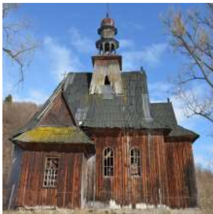
Zabytki sakralnej architektury drewnianej - kościoły w Rozłuczu, Ilniku i Wołczu, dzwonnica w Starej Soli, Towarzystwo Miłośników Lwowa i Kresów Południowo-Wschodnich w Bytomiu, dofinansowanie 30 000 zł