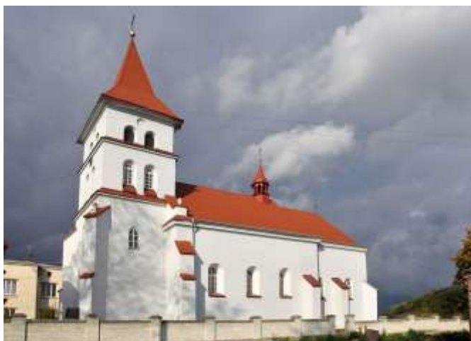
Badania architektoniczno-konserwatorskie kościoła pw. św. Stanisława w Szczercu, Oddział Towarzystwo Opieki nad Zabytkami w Warszawie, dofinansowanie 37 270 zł