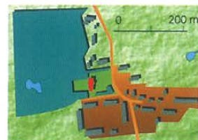
Plan sytuacyjny / Lageplan