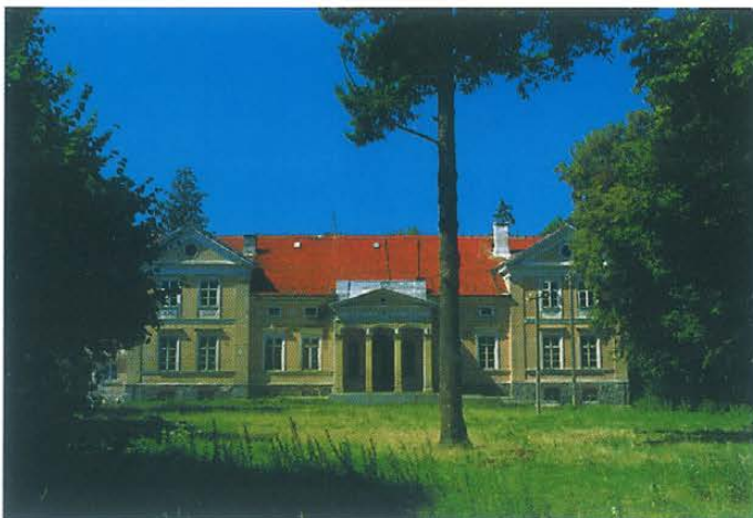
Widok od strony podjazdu / Ansicht von der Auffahrt her