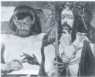
Jacek Malczewski Chrystus przed Piłatem

ków politycznych, przestało mieć trwale charakter polski, gdyby pod względem narodowym polskość swoją utraciło, (...) przejść mają zbiory powyższe na własność Muzeum Narodowego w Wawelu w Krakowie, a gdyby to było trudne do wykonania, (...) stać się mają własnością Państwa Polskiego i umieszczone być mają w Warszawie, Poznaniu, Wilnie lub Gdańsku (...). 2