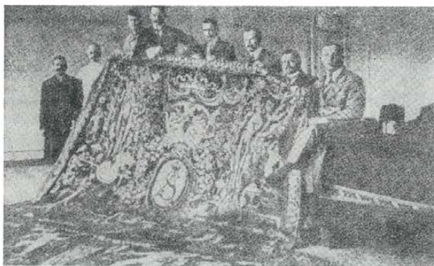
Członkowie delegacji polskiej przy odbiorze arrasów wawelskich

W wyniku Układu do Polski powróciły między innymi: Szczerbiec, chorągiew Wielka Koronna Zygmunta Augusta, kolejna część arrasów wawelskich, ekwiwalent za zbiór numizmatyczny Uniwersytetu Warszawskiego (pierwotnie ponad 18 tys.) włączony do zbiorów Ermitażu, liczący przeszło 11 tys. monet i medali, a także wiele cennych zabytków ze zbiorów Towarzystwa Przyjaciół Nauk, Biblioteki Żałuskich i kolekcji Stanisława Augusta oraz pamiątek powstań narodowych.