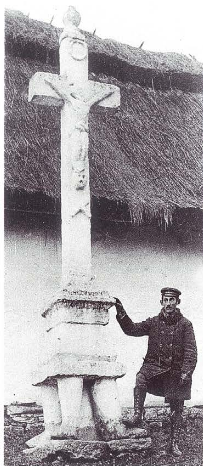
Krzyż kamienny na postumencie z czterema dolnymi odnóżami ludzkimi

Pierwsza z zaplanowanych publikacji, katalog prezentujący straty malarstwa polskiego, obejmuje zaledwie znikomą część zniszczonych lub zaginionych w wyniku II wojny światowej dzieł polskich artystów. Znalazły się w nim bowiem tylko te obrazy, których identyfikacja – dzięki zachowanym fotografiom – nie będzie trudna. Pominięto natomiast wiele dzieł, o których wyglądzie można jedynie domniemywać z mniej lub bardziej szczegółowych opisów. Autorki opracowały i zweryfikowały zebrany materiał w sposób niezwykle rzetelny. Ich benedyktyńska praca uwieczniona została wspaniałym efektem – z 442 ilustracji poznajemy obrazy, które, jak się może wydawać, są raczej bezpowrotnie stracone dla polskiej kultury. Jednak, jak uczy praktyka, zaginione dzieła sztuki pojawiają się na rynku antykwarycznym lub odnajdują się w zbiorach muzealnych za granicą i dlatego publikacja tego katalogu jest tak ważnym wydarzeniem. W wielu wypadkach może umożliwić zidentyfikowanie prac polskich artystów, utra-