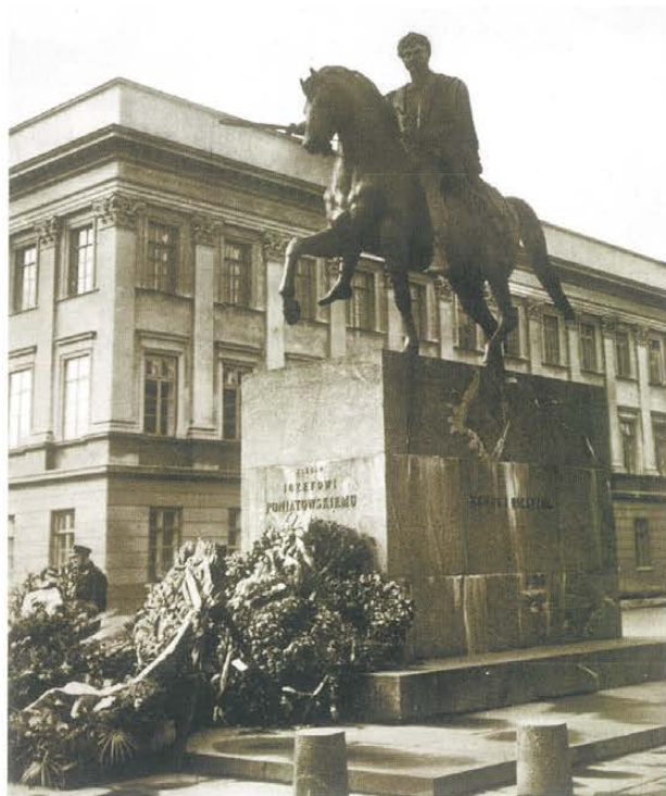
Odzyskany pomnik ks. Józefa Poniatowskiego przed Pałacem Saskim na placu J. Piłsudskiego. Okres międzywojenny

4. Różewicz J.: Polsko-radzieckie stosunki naukowe w latach 1918-1939. Warszawa-Kraków-Gdańsk-Wrocław: 1979