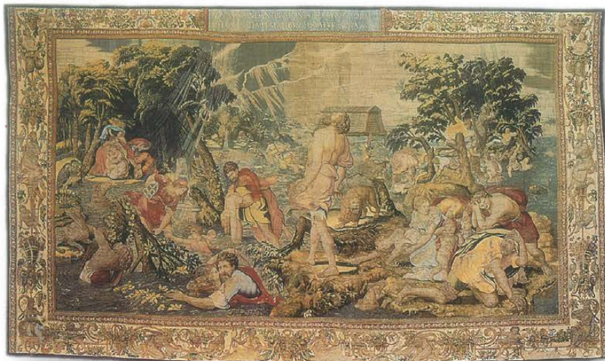
Potop, Bruksela ok. 1550, 477x835 cm