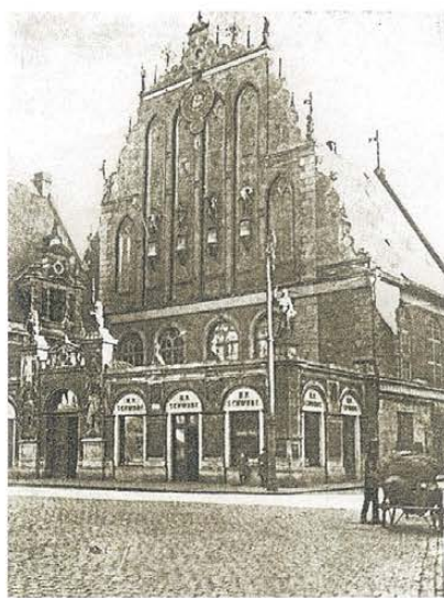
Pałac „Czarnogaźowców” w Rydze