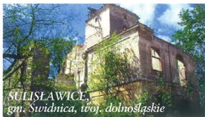
SULISŁAWICE, gm. Swidnica, woj. dolnośląskie

Agencja Własności Rolnej Skarbu Państwa poprzez swoje oddziały terenowe podejmuje różnorodne działania marketingowe mające na celu pozyskanie oferentów na nabywców nieruchomości zabytkowych. Nie wszystkie jednak obiekty cieszą się jednakowym zainteresowaniem. Są wśród nich takie, na które, pomimo wysokich wartości artystycznych i historycznych, w wyniku kolejnych przetargów nieograniczonych nie wyłoniono nabywcy i te określamy jako obiekty trudno zbywalne. Warto przypomnieć, że jeżeli nie ma zastosowania prawo pierwszeństwa w ich nabyciu, sprzedaż nieruchomości odbywa się w drodze przetargu. W przypadku nieroz-