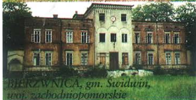
BIERZWNICA, gm. Swidwin, woj. zachodniopomorskie