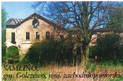
SAMLINO, gm. Golczewo, woj. zachodniopomorskie

Wiele jest powodów małego zainteresowania pozyskaniem na własność obiektów, które z różnych przyczyn stały się mało atrakcyjne. Podstawową barierą jest ich zasiedlenie przez byłych pracowników państwowych przedsiębiorstw gospodarki rolnej i brak innych, stosownych lokali do dyspozycji oddziałów terenowych na przekwaterowanie dotychczasowych najemców, z oczywistych bowiem względów niewielu jest chętnych do kupna obiektów wraz z umowami najmu. Wojewódzcy konserwatorzy zabytków w trosce o zachowanie historycznej całości z reguły nie wyrażają zgody na podział zespołów zabytkowych lub przeniesienie własności na dotychczasowych najemców, którzy chcą kupić jedynie poszczególne lokale w obiekcie zabytkowym. Mniejszym zainteresowaniem cieszą się te obiekty, w których otoczeniu nie ma parku i wody, natomiast obecnie znajdują się w bezpośrednim sąsiedztwie niedawno wybudowanych obiektów inwentarskich