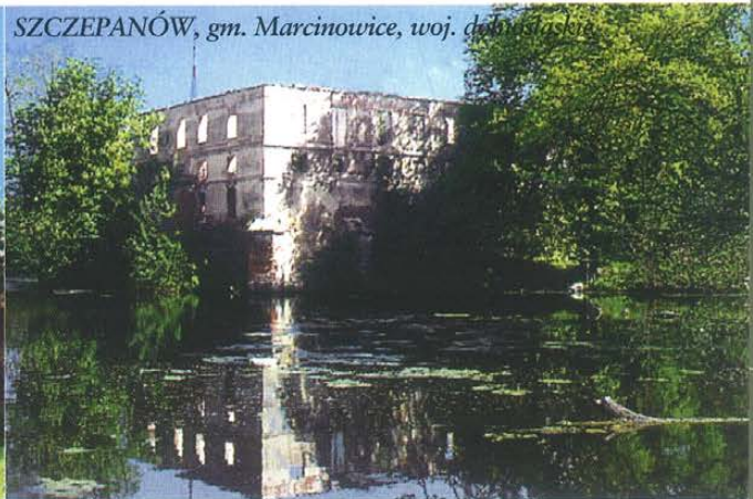
SZCZEPANÓW, gm. Marcinowice, woj. dolnośląskie