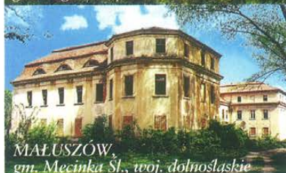
MAŁUSZÓW, gm. Męcinka Śl., woj. dolnośląskie

lub innych o uciążliwej produkcji. Zainteresowaniu nie sprzyja również utrudniony dojazd do obiektu, duża kubatura budynku, zły stan techniczny i związane z tym wysokie koszty remontu.