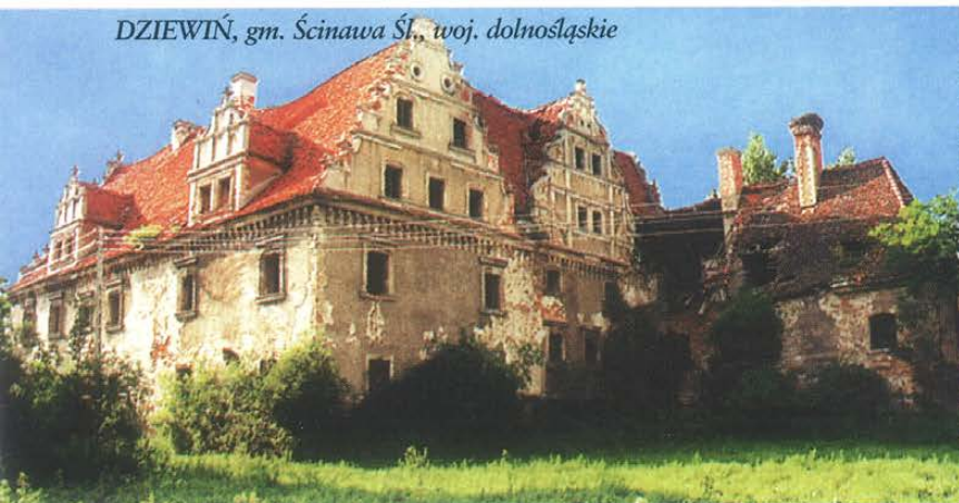
DZIEWIŃ, gm. Ścinawa Śl., woj. dolnośląskie