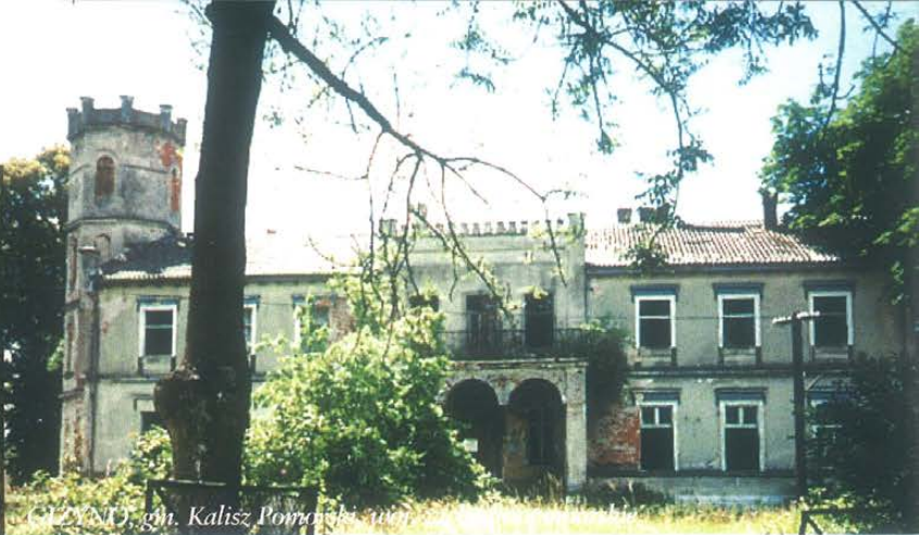
GLITAJNY, gm. Kalisz Pomorski, woj. pomorskie

ba zespołów trudno zbywalnych kształtuje się w granicach od jednego do sześciu. Dotychczas jedynie oddziały terenowe w Bydgoszczy, Lublinie i Warszawie uporały się z problemem obiektów trudnych do zbycia. Należy to jednak wiązać z – nieporównywalnym w stosunku do innych terenów – popytem na nieruchomości zabytkowe.