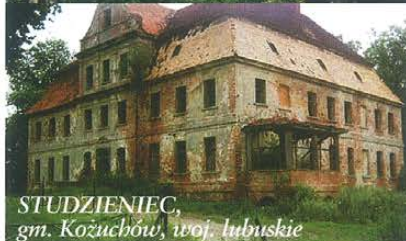
STUDZIENIEC, gm. Kozuchów, woj. lubuskie

strzygnięcia przetargu, korzystając z ustawy o gospodarowaniu nieruchomościami rolnymi Skarbu Państwa, Agencja ogłasza kolejne przetargi i może ustalić niższą cenę wywoławczą, nie niższą jednak niż cena wywoławcza ostatniego przetargu, aż do skorzystania z możliwości sprzedaży nieruchomości bez przetargu. W tym przypadku ustalona cena sprzedaży również nie może być niższa od ceny wywoławczej ostatniego przetargu. Agencja może także, w drodze umowy, nieodpłatnie przekazać nieruchomość gminie na cele związane z wykonywaniem zadań własnych, a zatem prowadzone są rozmowy z jednostkami samorządu terytorialnego. Gminy również nie przejawiają dużego zainteresowania przejmowaniem tych nieruchomości.