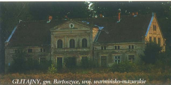
GLITAJNY, gm. Bartoszyce, woj. warmińsko-mazurskie