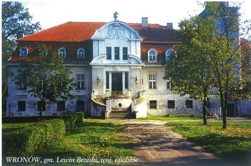
WRONÓW, gm. Lewin Brzeski, woj. opolskie

Agencja Własności Rolnej Skarbu Państwa poprzez swoje oddziały terenowe podejmuje różnorodne działania marketingowe mające na celu pozyskanie oferentów na nabywców nieruchomości zabytkowych. Nie wszystkie jednak obiekty cieszą się jednakowym zainteresowaniem. Są wśród nich takie, na które, pomimo wysokich wartości artystycznych i historycznych, w wyniku kolejnych przetargów nieograniczonych nie wyłoniono nabywcy i te określamy jako obiekty trudno zbywalne. Warto przypomnieć, że jeżeli nie ma zastosowania prawo pierwszeństwa w ich nabyciu, sprzedaż nieruchomości odbywa się w drodze przetargu. W przypadku nieroz-