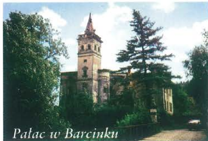
Pałac w Barcinku