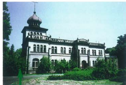
Zespół pałacowy w Osieku