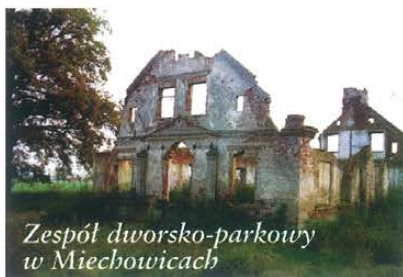
Zespół dworsko-parkowy w Miechowicach