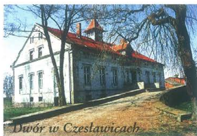
Dwór w Czesławicach