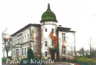
Pałac w Krąpiele