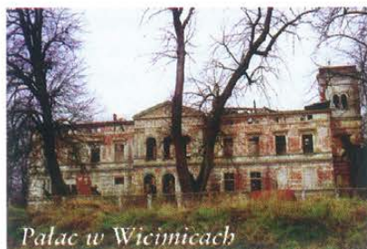
Pałac w Wicimicach