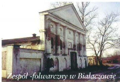
Zespół folwarczny w Białaczowie

W stosunkowo lepszym stanie niż obiekty pałacowe zachowały się zabytkowe obiekty gospodarcze, gdyż zdecydowanie mniej trwałych zmian dokonano w ich wnętrzach, prawdopodobnie dzięki