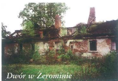
Dwór w Zerominie