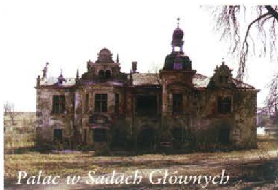
Pałac w Sadach Głównych