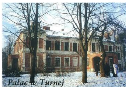
Pałac w Turnej

temu, iż na ogół były użytkowane zgodnie z ich pierwotnym przeznaczeniem, czyli na cele związane z produkcją rolną.