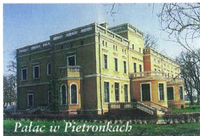
Pałac w Pietronkach