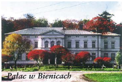
Pałac w Bienicach