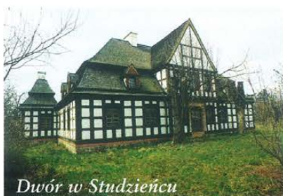
Dwór w Studziencu