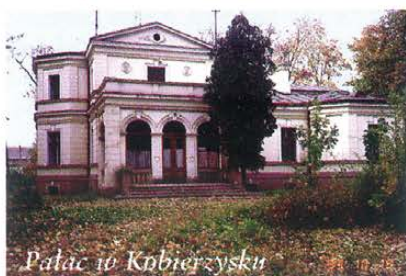
Pałac w Kobjerzysku