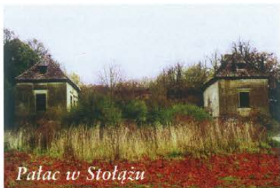
Pałac w Stołęża