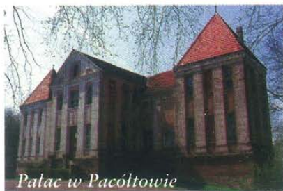
Pałac w Pacółtowie