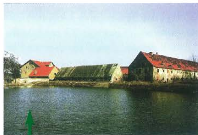
Zespół dworsko-folwarczny w Lipie