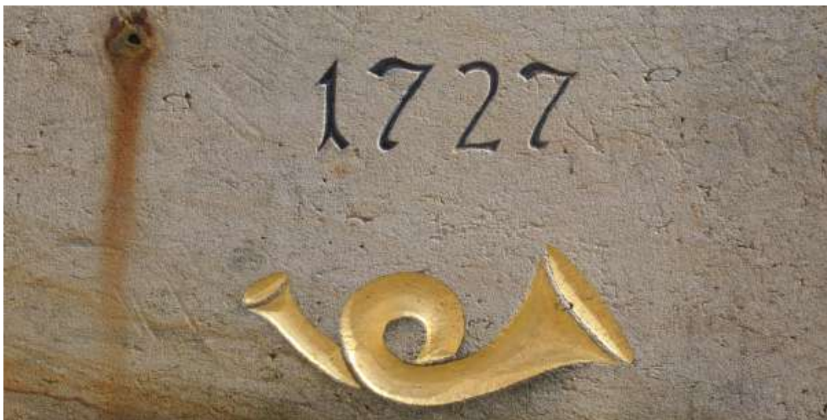
Fot. 5 Słup poczty polsko-saskiej w Nossen (Saksonia).

Duża liczba słupów dystansowych uległa zniszczeniu, głównie w czasie II wojny światowej. W wielu miasteczkach (przede wszystkim w Saksonii) podjęto się rekonstrukcji tych niezwykle oryginalnych zabytków w ich pierwotnych miejscach usytuowania. Liczba zachowanych lub zrekonstruowanych słupów kształtuje się na poziomie ponad dwustu udokumentowanych obiektów 6 . W tym miejscu warto wspomnieć o wybranych słupach, na które można natrafić już po polskiej stronie współczesnej granicy polsko-niemieckiej. Ciekawym przykładem rekonstrukcji pozostaje słup w Lubaniu (niem. Lauban), znajdujący się obecnie na rynku tego dolnośląskiego miasta. Jest wierną repliką (2005 r.) jednego z trzech słupów dystansowych, ustawionych w tym mieście w 1725 roku. (Fot. 6) Oryginał stał