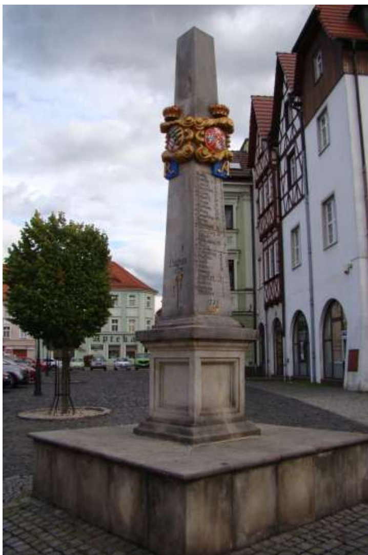
Fot.6 Słup poczty polsko-saskiej w Lubaniu (Polska).

pierwotnie przy Bramie Zgorzeleckiej. Przed II wojną światową został przeniesiony niedaleko barokowego „Domu pod Okrętem”. Po 1945 r. w niewyjaśnionych okolicznościach zaginął 7 .