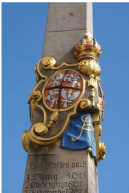
Fot. 4 Słup poczty polsko-saskiej w Nossen (Saksonia).

Bolesławiec (niem. Bunzlau), Legnicę (niem. Liegnitz), Wrocław (niem. Breslau), Oleśnicę (niem. Oels), Syców (niem. Wartenberg), Piotrków Trybunalski i Mszczonów do Warszawy 4 . W 1732 r. uruchomiono jeszcze jeden szlak pomiędzy ww. głównymi dworami – przez Kargową, Poznań i Sochaczew. Tę drogę kurier, przewożąc listy wagi państwowej, pokonywał w trzy dni 5 .