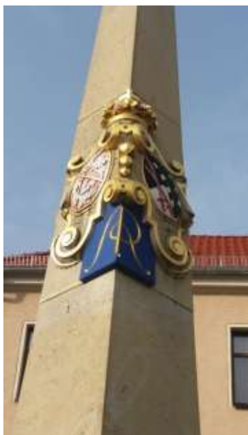
Fot. 3 Słup poczty polsko-saskiej w Großenhain (Saksonia).

Najbardziej okazałe słupy dystansowe ustawiano przy bramach miejskich lub w bezpośredniej bliskości rynku (niem. Markt). To właśnie na tych obiektach można jeszcze odnaleźć godła