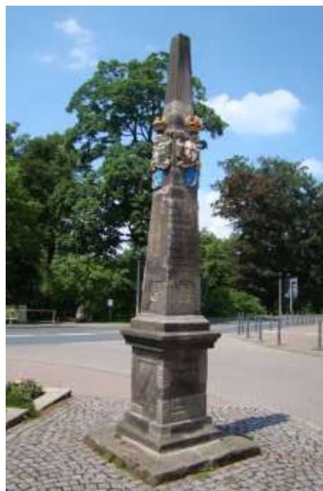
Fot. 2 Słup poczty polsko-saskiej we Freibergu (Saksonia).

W tym czasie stawiane były pod jego nadzorem i kierownictwem milowe kolumny pocztowe kilku rodzajów: kolumna odległościowa (dystansowa), kolumna ćwierćmilowa, kolumna półmilowa i milowa - przy czym warto zaznaczyć, że pół mili pocztowej było równe jednej godzinie i dystansowi