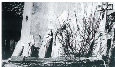
▲ Usunięte przez Niemców z kościoła figury świętych i nagrobki