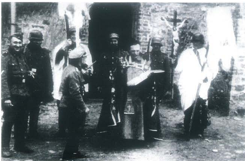
▲ „Gott mit uns” na klamrach pasów i kpina z wartości religijnych w rzeczywistości