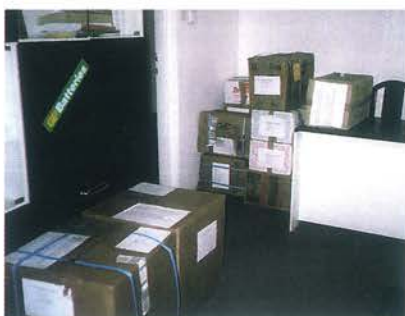
▼ Materiały po przewiezieniu z lotniska do magazynu MKiDN.