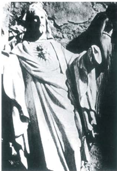
▲ Figura Chrystusa przed kościołem w Poznaniu

rier Polski” (Bagdad) oraz „Polak w Iranie”, które było wydawane również po zakończeniu wojny.