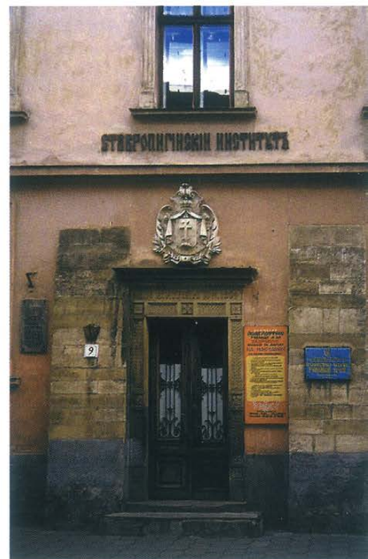
▼ Muzeum Stauropigialne – wejście. Fot. J. Miler, 2000 r.