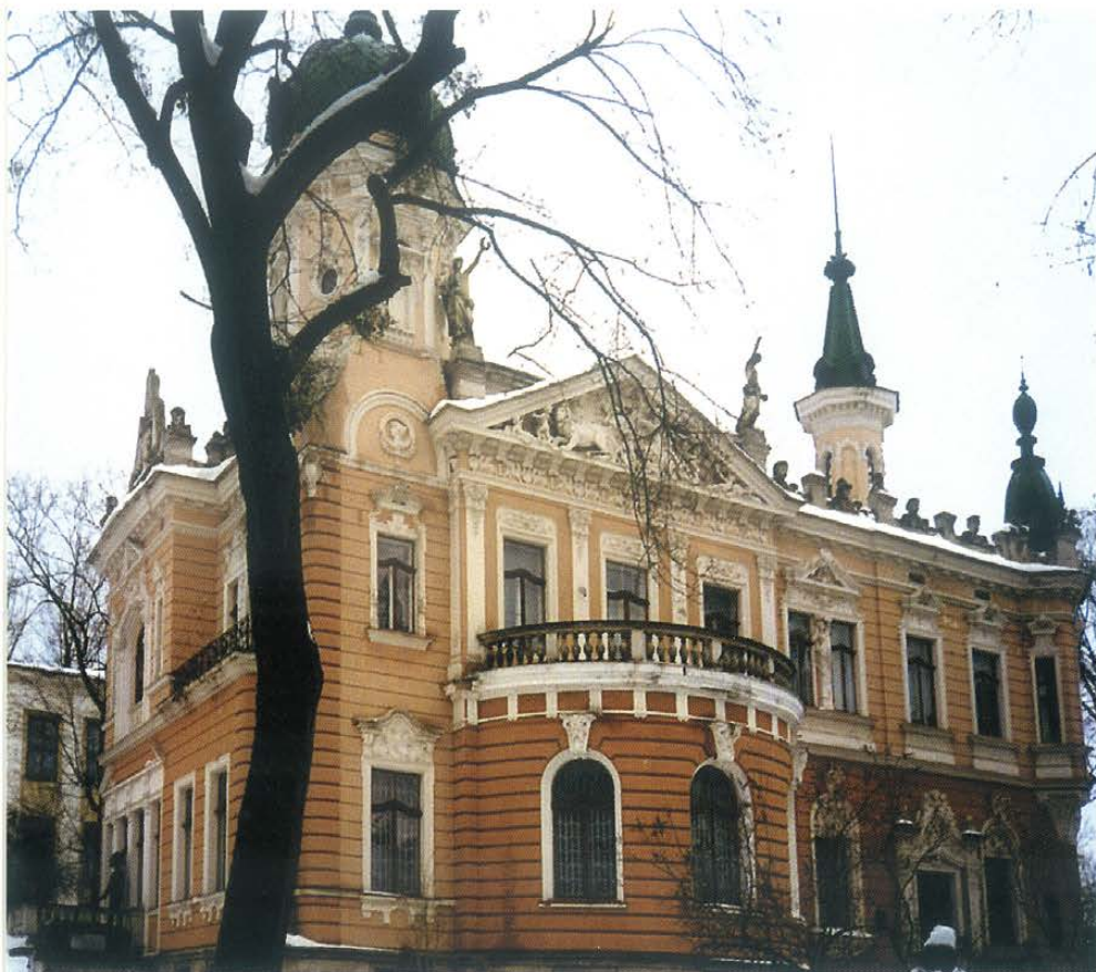
▲ Ukraińskie Muzeum Narodowe. Fot. J. Miler, 2001 r.