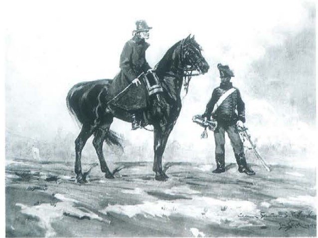
▲ Replika fragmentu Panoramy Siedmiogrodzkiej Jana Styki, 1898 r.

nerała Józefa Bema w sposób niekonwencjonalny, niespotykany we wcześniej powstałych litografowanych scenach batalistycznych. Zgodnie z prawdą – na podstawie informacji zawartych w pamiętnikach z tamtego okresu – przedstawił więc Bema jako człowieka starego, o skromnej powierzchowności, ubranego w szary płaszcz honwedzki i kapelusz z piórem. Interpretacja ta zgadza się z opisem Stanisława Schnür-Peplowskiego, który oglądał panoramę w całej świetności w 1897 r. we Lwowie i opisał w pracy Bem w Siedmiogrodzie , Lwów 1897. Cytując: Wódz nasz siedzi na wspaniałej klaczy pełnej krwi angielskiej, ubranej w rząd węgierskiego jenerała, w skromnym płaszczu honwedzkim, z historyczną szpicrutą w rękę, bez broni, patrzący z wytężoną uwagą na most zdobywany przez Szeklerów.