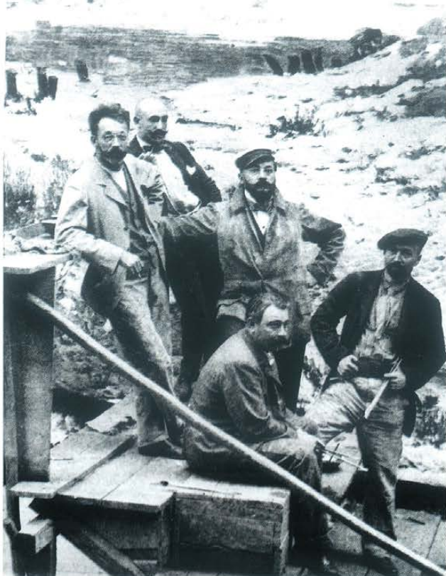
▲ Autorzy Panoramy Siedmiogrodzkiej: Z. Rozwadwski, J. Styka, P. Vágo, B. Spányi, W. Wywiórski, Lwów 1897 r.

panoramy, wydany w 1898 r. w Budapeszcie. W 1992 r. Muzeum wydało faksymilie tej publikacji. Kolejne wydawnictwo poświęcone panoramie, wydane 1997 r., zawierało barwne reprodukcje zlokalizowanych już wówczas 22 brytów.