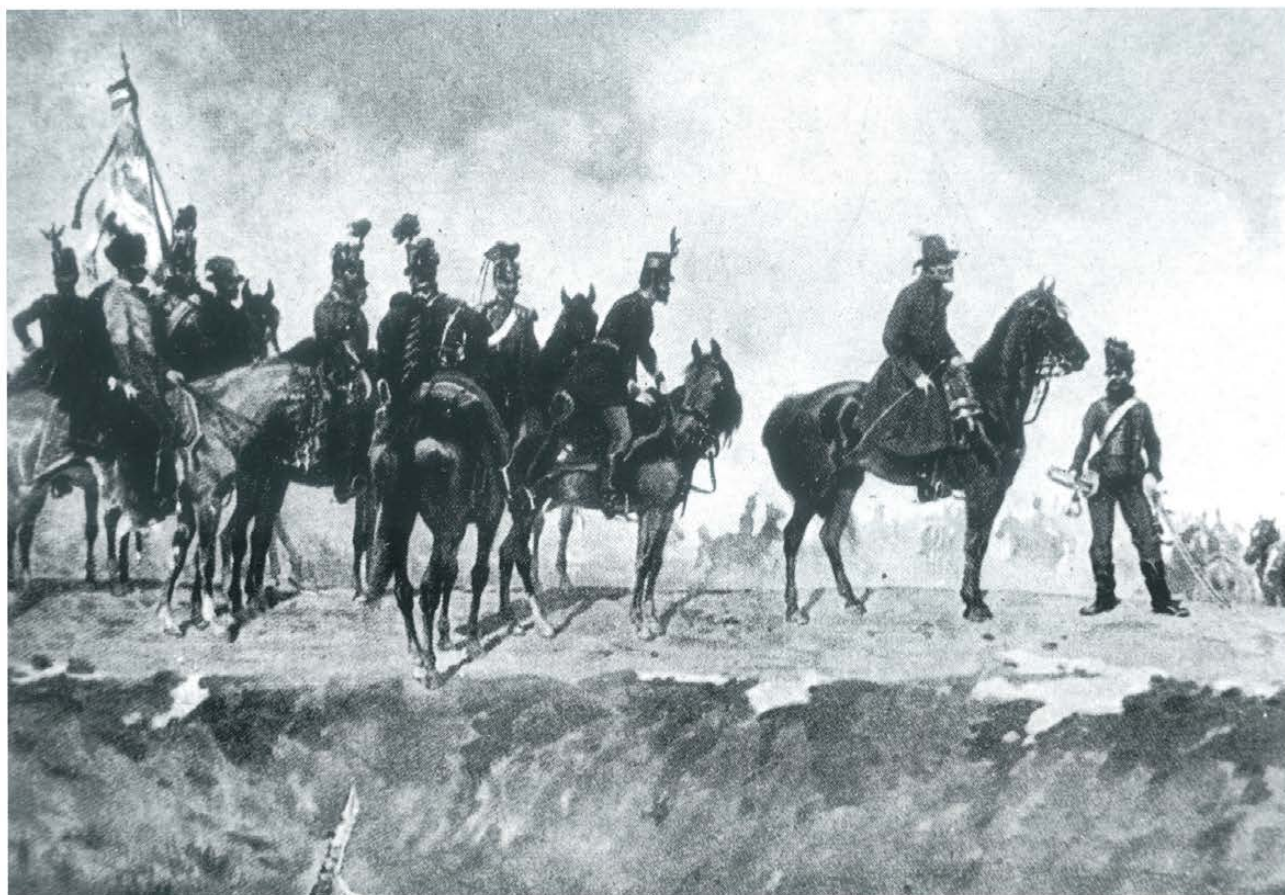
▲ General Józef Bem ze sztabem – zaginiony fragment Panoramy Siedmiogrodzkiej . Reprodukacja z katalogu panoramy.