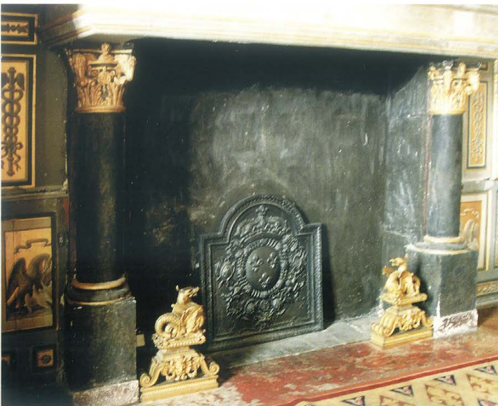
◀ Płyta kominkowa w jednej z Komnat Królewskich w pałacu w Fontainebleau (Francja)

wały powietrze znajdujące się w kanale za nimi; kanał miał wylot w pomieszczeniu obok, za ozdobnymi zwykle drzwiczkami. Ten rodzaj ogrzewania kanałowego był popularny w Niderlandach, Francji, Anglii oraz południowych Niemczech.