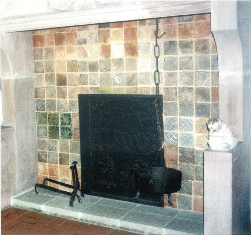
▲ Płyta kominkowa ostaniająca ścianę. Muzeum Zamkowe w Marburgu (Niemcy)

mieszczeniu do skomplikowanych konstrukcji, wbudowanych niejako w ściany domu i ogrzewających nawet kilka pomieszczeń. Na początku XIX w. upowszechniły się, szczególnie w domach mieszczańskich, piece żeliwne o przekroju koła lub owalu.