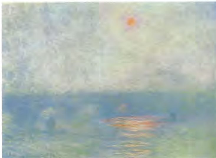
Claude Monet Most Waterloo – słońce we mgle

przedmioty o znaczeniu dla archeologii, prehistorii, artystycznym lub naukowym, przedmioty etnograficzne o wartości powyżej 500 dolarów, sztuka zdobnicza powyżej stu lat, meble o wartości przekraczającej 2 tys. dol., rysunki, akwarele, grafiki o wartości powyżej tysiąca dolarów oraz wszelkie przedmioty powyżej 3 tys. dol.