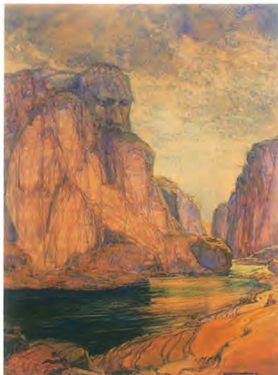
Franz Johnston Strażnik wąwozu