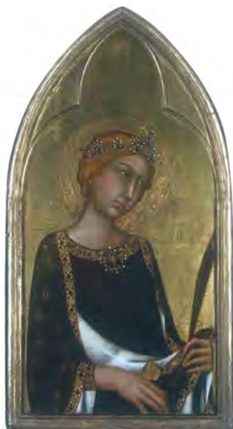
Simone Martini Święta Katarzyna z Aleksandrii