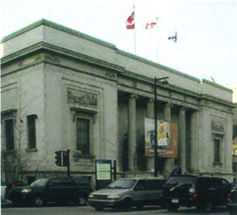
Muzeum Sztuk Pięknych w Montrealu