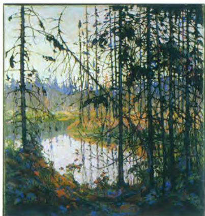
Tom Thomson Północna rzeka

stów kanadyjskich, a niektóre obrazy osiągają ceny kilku milionów dolarów. Płótna oddają hołd wspaniałej przyrodzie w charakterystycznym stylu o śmiałych barwach i teksturach, zrywającym z ówczesnymi tendencjami malarstwa kanadyjskiego.