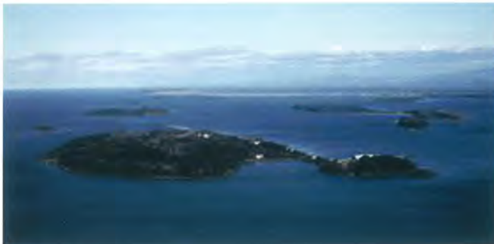
Miejsce pamięci narodowej Grosse Ile

Head-Smashed-In Buffalo Jump w prowincji Alberta, wpisane na Listę Dziedzictwa Światowego w 1981 r. to świadectwo archeologii ilustrujące tysiącletnie praktyki łowieckie Indian zamieszkujących prairie. Stare Miasto Québec, które znalazło się na Liście Dziedzictwa Światowego w 1985 r., upamiętnia czas panowania Francji. Założone przez francuskiego odkrywcę Samuela Champlaina w 1608 r. jest jedynym miastem w Ameryce Północnej, które zachowało w całości mury