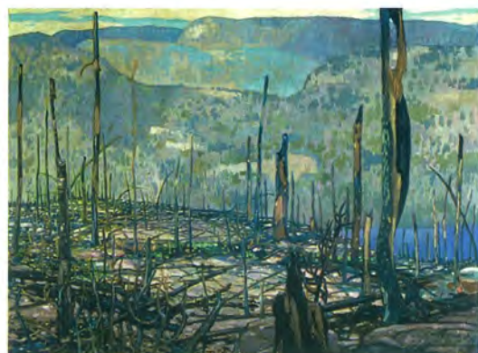
Franz Johnston Pogorzelisko