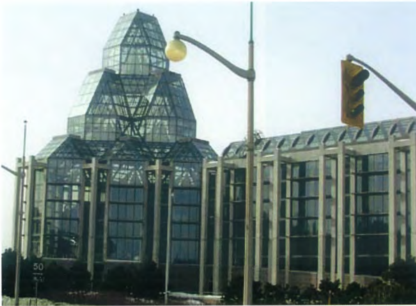
Muzeum w Ottawie