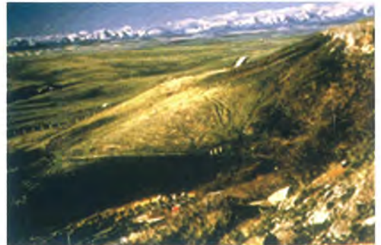
Miejsce pamięci narodowej Head Smashed In Buffalo Jump