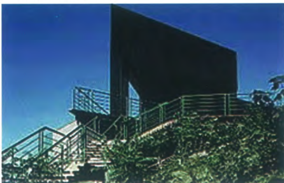
Pomnik upamiętniający bitwę na rzece Restigouche

lonialną Anglii, opartą na podboju militarnym, upamiętnia sieć fortyfikacji oraz pól bitewnych. Miejsce bitwy na rzece Restigouche upamiętnia ostatnią walkę wojny siedmioletniej, która zakończyła się podbojem Nowej Francji przez Anglię. Przeprowadzono tam w latach siedemdziesiątych największe w skali światowej podwodne wykopalska. Pamięć o emigracji to pomnik Irlandczyków na Grosse Ile w prowincji Québec, przez którą emigranci, przede wszystkim z Irlandii, napływali od początku XIX w. aż do wybuchu I wojny światowej. Jedyne miejscem pamięci narodowej poza granicami kraju są wykupione przez rząd kanadyjski tereny pól bitewnych w Vimy w pobliżu Verdun. Liczne ekipy konserwatorskie regularnie restaurują dostępne dla zwiedzających umocnione okopy.