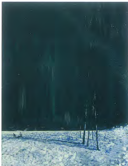
Franz Johnston Północna noc