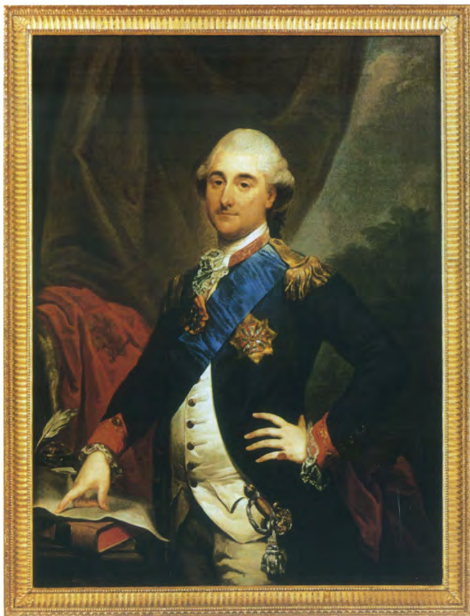
Stanisław August w granatowym mundurze kadeckim. Marcello Bacciarelli. Olej, płótno, 129 x 97 cm, XVIII w.

P racownia Dokumentacji Księgozbiorów Historycznych (PDKH) Biblioteki Narodowej w Warszawie zajmuje się od wielu lat badaniami nad spuścizną polskiego kolekcjonerstwa książek. W ramach tych prac próbujemy także odtworzyć losy księgozbioru króla Stanisława Augusta. Stąd z wielkim zainteresowaniem przyjęliśmy informacje zawarte w artykule Alesi Sawczuk 1 , pracownika naukowego z Państwowego Muzeum Historyczno-Archeologicznego w Grodnie, która opisała zachowany w bibliotece Muzeum egzemplarz książki z super-ekslibrisem i podpisem króla.