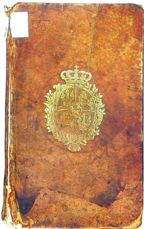
Górna okładzina z królewskim supereklibrisem (nakładowym)

Białoruski Almanach Historyczny ma w Polsce wąskie grono odbiorców, stąd pomysł, by upowszechnić dane z publikacji A. Sawczuk i uzupełnić wynikami własnych badań przeprowadzonych w PDKH 2 . Grodzieńska autorka przystała na tę sugestię i udostępniła nam materiał ilustracyjny, który nie był publikowany w Almanachu Historycznym . Prezentujemy obecnie skróconą wersję tekstu, który powstał na podstawie nowych materiałów i źródeł. Podjęto w nim próbę odtworzenia historii zachowanej w Grodnie książki. W całości tekst ten będzie opublikowany w Roczniku Biblioteki Narodowej 3 .