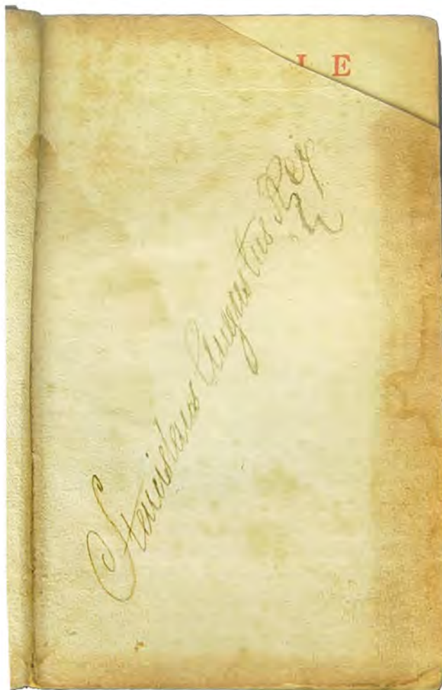
Wyklejka z autografem Stanisława Augusta Poniatowskiego

Autograf króla znalazł się na pracy Friedricha Augusta Schmidta (1734-1807) Dzieje Królestwa Polskiego krótko lat porządkiem opisane, na język polski przełożone, poprawione i przydatkiem panowania Augusta III pomnożone , wydanej w Warszawie