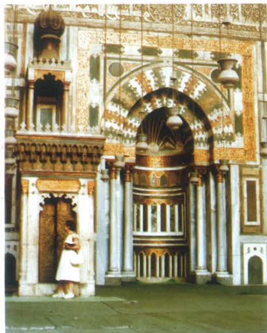
▲ Mihrab meczetu, we wschodnim liwanie zorientowanym w kierunku Mekki.