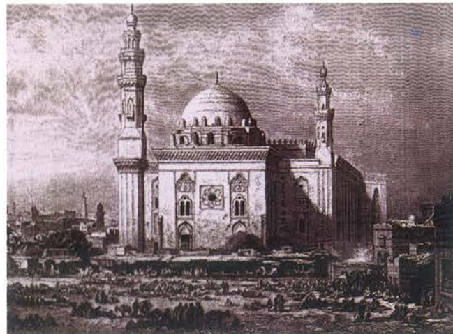
▲ Fryz ornamentalny z tekstem zaczerpniętym z 48 sury Koranu – z meczetu sultana Hassana (wg Ebers, op.cit.)

W czasach mameluków lampiony te tworzyły olśniewającą iluminację meczetu, rozbrzmiewającego głosami czcigodnych znawców prawa i uczniów zasiadających u ich stóp. Madrasa sultana Hassana przyciągała bowiem całe rzesze studentów, zamieszkujących niewielkie pomieszczenia usytuowane na czterech poziomach na zapleczu każdego z owych liwanów. Dzisiaj wnętrza liwanów pogrążone są w głębokiej ciszy, którą zakłóca tylko śpiew ptaków, szybujących wysoko ponad dziedzińcem, zakłócony od czasu do czasu głosami turystów wkraczających świętokradczo w mury tego przybytku. Na wezwanie muezzina meczet wypełnia się jednak grupkami wiernych, którzy tak jak przed wiekami sławią Boga, recytując święte wersety Koranu. Insrypcje zapisane nad wejściami do każdego z liwanów wciąż jednak głoszą chwałę władcy, który ufundował tę budowlę: Męczyński sultan al-Malik an-Nasir Hassan ibn al-Malik an-Nasir Muhammad ibn Kalaun rozkazał wznieść tę budowlę. (którą ukończono) w miesiącach roku 764 (Hidżry = 1363 r. po Chr.) .