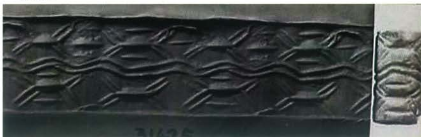
▼ Pieczęć cylindryczna i jej odcisk