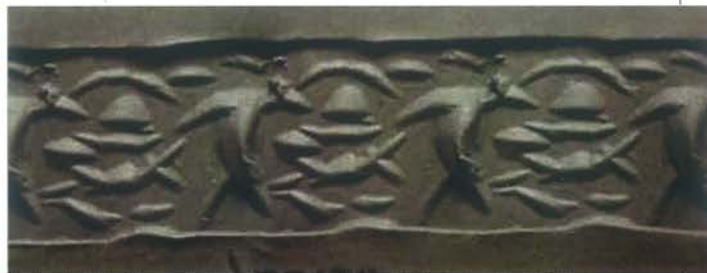
▶ Odcisk pieczęci cylindrycznej