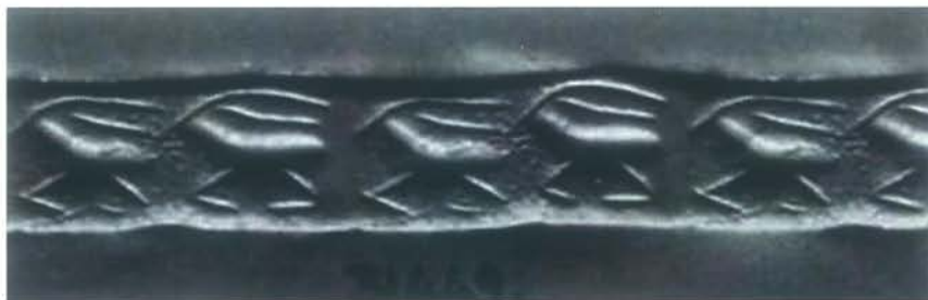
▲ Odcisk pieczęci cylindrycznej