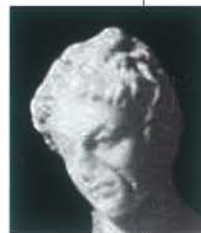
▲ Głowa boga Apolla, ok. 160 r. p.n.e.

Na podstawie artykułu Martina Bailey'a w Le Journal Des Arts , nr 176 z 25.09.2003 r.