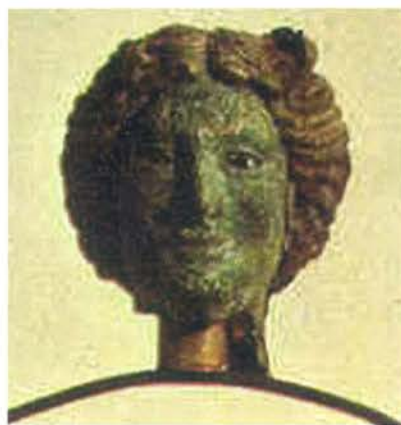
▲ Głowa bogini Viktorii, 200 r. p.n.e.

w jej i Archiwum Narodowego, strata zbiorów jest mniejsza niż się obawiano. Podobnie jak w przypadku Muzeum Archeologicznego, bibliotekarze przenieśli najcenniejsze przedmioty w bezpieczne miejsca.