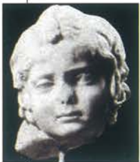
▲ Głowa Erosa, ok. 160 r. p.n.e.