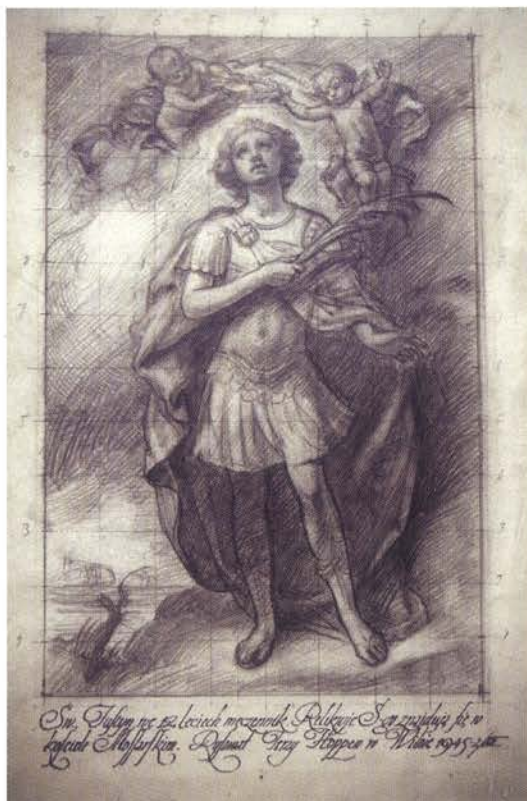
▲ Jerzy Hoppen, rysunek do obrazu Św. Justyn, Toruń, Biblioteka UMK.

W Lietuvos Dailes Muziejos w Wilnie przechowywany jest miedzioryt przedstawiający św. Justyna Męczennika stojącego na tle krajobrazu z kościołem w Starym Miadziole, trzymającego w rękach krucyfiks i gałąź palmową. Nad głową