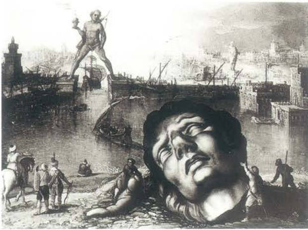
▲ Kolos rodyjski