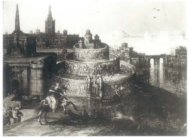
▲ Świątynia Diany w Efezie