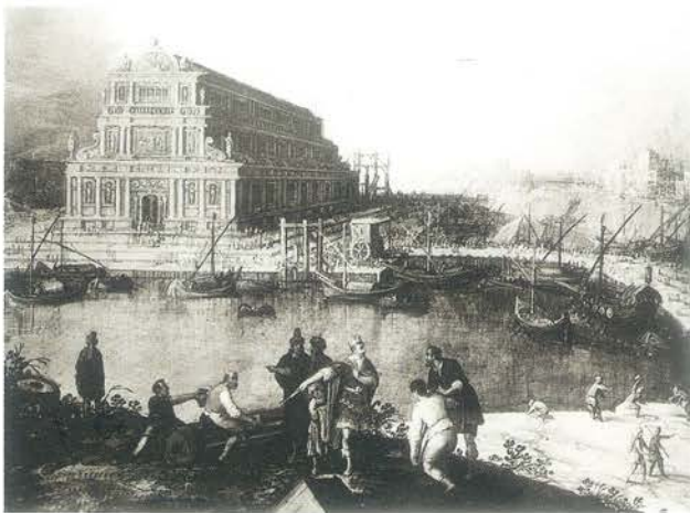
▲ Mauzoleum w Holikornosie

z szesnastowieczną legendą, posąg Heliosa stopy opierał na falochronach broniących wejścia do portu, a między jego nogami przepływały statki. Zapewne aluzją do trzęsienia ziemi, które zniszczyło pomnik w 224 r. p.n.e., jest zwalona głowa i dłoń kolosa na pierwszym planie. Świątynia Diany w Efezie, otoczona trzema pierścieniami murów ozdobionych płaskorzeźbami, niewiele ma wspólnego z przekazanym przez źródła opisem. Wznosząca się spiralnie w górę wieża przedstawia latarnię morską w Aleksandrii, którą z inicjatywy Ptolemeusza I Sotera wybudował ok. 300–280 r. p.n.e. architekt Sostratos z Kidos. Tę pierwszą latarnię morską – olbrzymią wieżę mierzącą ok. 120 m wysokości, której płomień widoczny był z odległości 30 km – wystawiono na Faros, niewielkiej wysepce naprzeciw Aleksandrii. Za czasów Aleksandra Wielkiego i na jego polecenie połączono wysepkę z nadbrzeżem stałym mostem. Jego