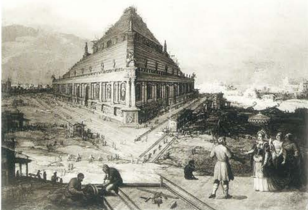
▼ Wiszące ogrody Semiramidy

fragmentów można się dopatrzeć na obrazie. Kolejna, niezwykle okazała wolno stojąca budowla o kilku kondygnacjach to Mauzoleum w Halikarnasie. Namalowane przez Franckena piramidy przypominają raczej egipskie obeliski, a wiszące ogrody Semiramidy pną się wysoko w górę na wąskich tarasach stromej, podobnej do piramidy budowli. Posąg Zeusa przedstawia rzeźbę nadnaturalnej wielkości, włożoną do otoczonej kolumnadą centralnej świątyni – bardzo zbliżoną formą do wspomnianej powyżej akwaforty Tempesty. Ósmym cudem świata jest natomiast rzymskie Koloseum.