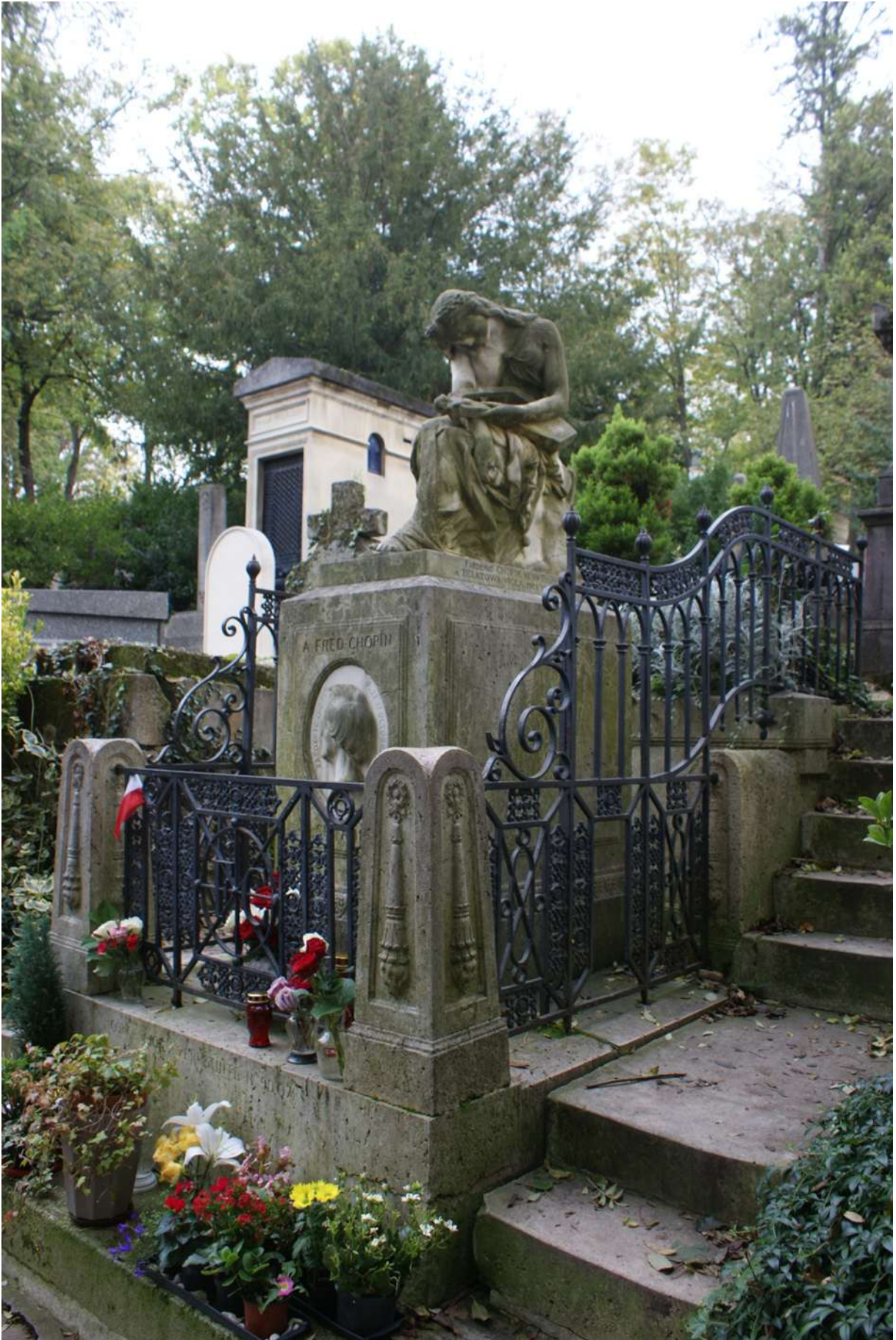
Fot. 1 Cmentarz Père-Lachaise w Paryżu; grób F. Chopina przed pracami konserwatorskimi w 2017 r.