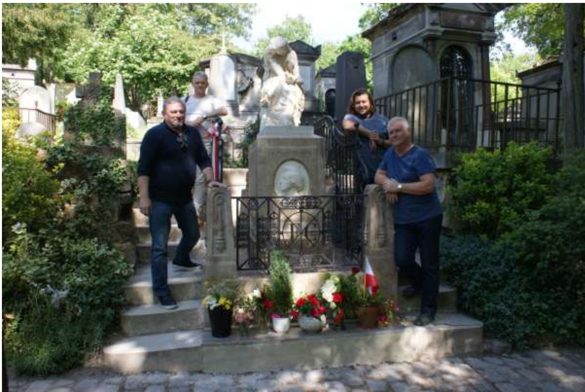
Fot. 12. Autorzy artykułu przy grobie Chopina na cmentarzu Père-Lachaise, po zakończeniu prac konserwatorskich.

Warunkowość niezbyt jasno zawarta w pozwoleniu zakładała konieczność akceptowania przez dyrekcję cmentarza Père-Lachaise przygotowywanych przez konserwatorów próbek metod oczyszczania powierzchniowego.