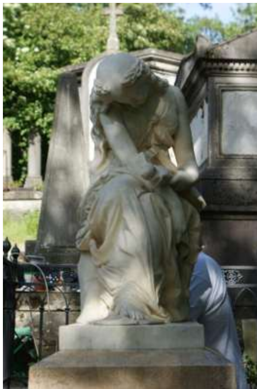
Fot. 9. Cmentarz Père-Lachaise; grób Chopina po pracach konserwatorskich.

W 2007 r. Rada Paryża przychyliła się do wniosku wpisania grobu Chopina na Listę Pomników Historycznych Francji. Akceptacja ta została usankcjonowana przez odpowiednie zarządzenie Ministra Kultury Republiki Francuskiej datowane na 1 kwietnia 2008 roku.