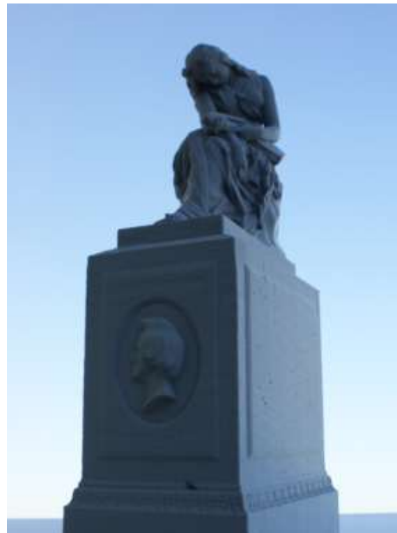
Fot. 3. Model 3 D pomnika nagrobnego F. Chopina z cmentarza Père-Lachaise w Paryżu wykonany w ramach wstępnych prac dokumentacyjnych przed konserwacją obiektu.

Pierwsze takie prace zainicjowane przez Muzeum Chopina przy Towarzystwie im. Fryderyka Chopina w Warszawie, sfinansowane przez