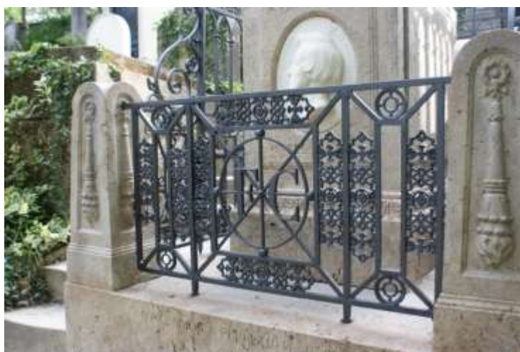
Fot. 10-11. Cmentarz Père-Lachaise; grób Chopina po pracach konserwatorskich.

Pozwolenie (jak się później okazało – warunkowe) zostało wydane w końcu lata. Negatywnie władze francuskie odniosły się do propozycji zastosowania laserowego oczyszczania powierzchni kamiennych, a uzasadnieniem tego było powołanie się na złe efekty wcześniej wykonanych prób przy innych obiektach cmentarnych.