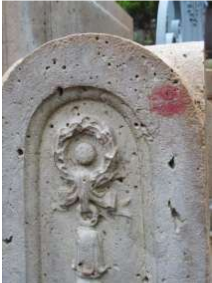
Fot. 2. Cmentarz Père-Lachaise w Paryżu; grób F. Chopina; ślad pocałunku złożonego na słupku ogrodzenia.

przypadki. Przykładem trudnym do zakwalifikowania w kontekście socjologicznym może być ślad czerwonej szminki pozostawiony na słupku ogrodzenia grobu kompozytora (Fot. 2). Zdarzają się – niestety coraz częściej – bardziej wymyślne działania mające na celu manifestację uczuć.