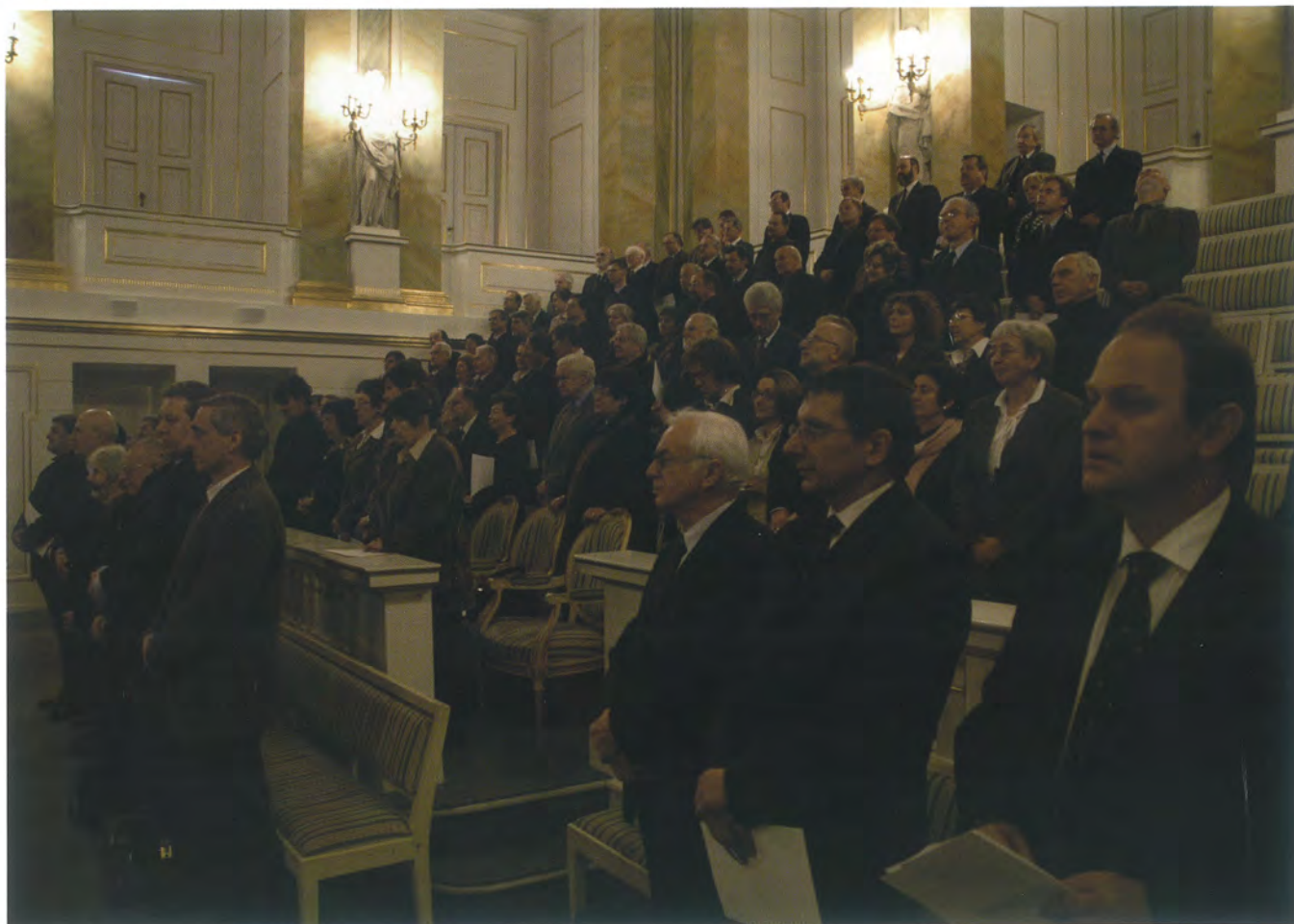
Uroczystość ślubowania rzeczoznawców, zgodnie z tekstem roty przyrzeczenia znajdującym się w rozporządzeniu ministra kultury dotyczącym rzeczoznawców.