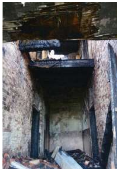
Komora celna w Silnie , straty spowodowane bezpośrednio pożarem w dniu 26 maja 2016