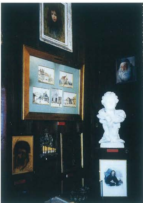
Fragment ekspozycji Judaików w zbiorach Muzeum Polskiego w Rapperswilu

(1815-1817) spędził w Szwajcarii. W miejscu jego pobytu, w miasteczku Solothurn, ufundowano w latach 30. XX w. przy wsparciu władz polskich Muzeum im. Tadeusza Kościuszki. Środki na jego zorganizowanie pozyskiwano m.in. z wpływów z koncertów światowej sławy polskiego pianisty, a także premiera rządu w II Rzeczypospolitej, Ignacego Paderewskiego. Podobnie jak Muzeum w Rapperswilu placówka ta działa z powodzeniem do dnia dzisiejszego.