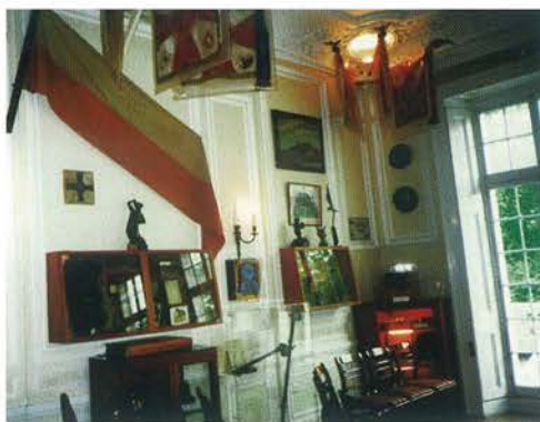
Sala wystawowa w Instytucie polskim i Muzeum im. gen. Sikorskiego w Londynie