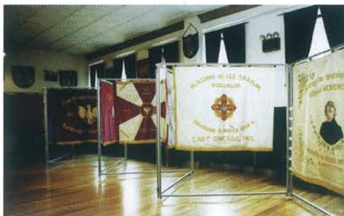
Ekspozycja historycznych sztandarów w Muzeum Tradycji Oręża Polskiego w Nowym Jorku