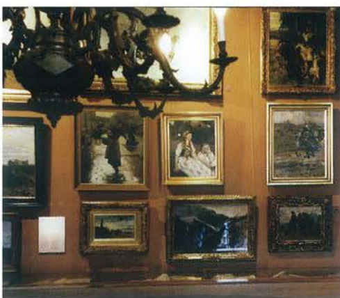
Fragment ekspozycji ze zbiorów malarstwa w Muzeum polskim w Rapperswil