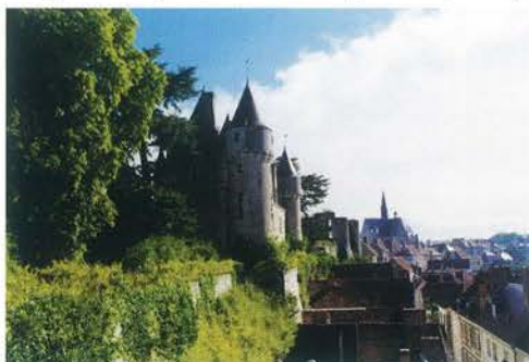
Zamek w Montrésor. Siedziba Muzeum