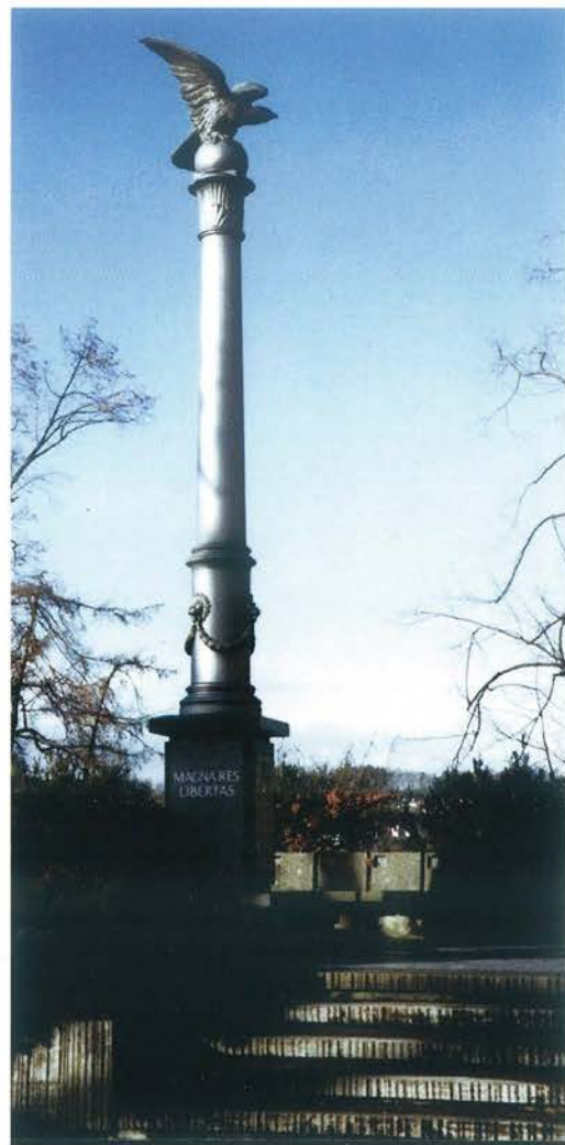
Kolumna barska ufundowana w 1868 r. przed wejściem do Muzeum Polskiego w Rapperswilu

Upadek powstania styczniowego był powodem kolejnej fali odpływu Polaków do innych krajów. Do Rosji wywieziono 40 tys. osób. Ponad 5 tys., uciekając przed prześladowaniami politycznymi władz zaborczych, wybrało emigrację do Francji, Stanów Zjednoczonych, Turcji, Szwajcarii, Włoch, Belgii oraz Anglii. Wielu z nich włączyło się w działania na rzecz odzyskania niepodległości przez Polskę w swoich nowych ojczyznach. Powstawały kolejne polskie instytucje gromadzące pamiątki narodowe. Jedną z istotnych dla kultury polskiej inicjatyw było założenie Muzeum Polskiego w Rapperswilu w Szwajcarii, co nastąpiło z inicjatywy Władysława hr. Broel-Platera. Założyciel tej placówki przekazał je w końcu XIX w. na własność narodowi polskiemu. Rapperswil stał się w okresie braku